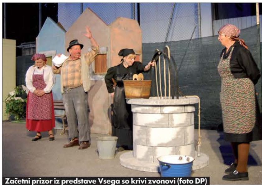
Začetni prizor iz predstave Vsega so krivi zvonovi

streho, ločenca Oscarja, ki mu je red deveta briga in ima zelo rad hrupno družbo prijateljev ob igranju na karte, in maniakalno redoljubnega Felixa, ki se kot kup nesreče ločuje od žene, seveda po