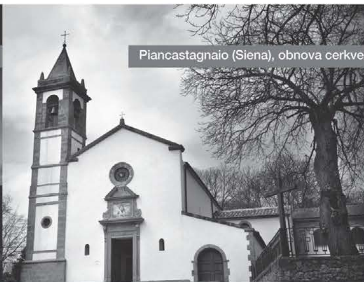
Piancastagnaio (Siena), obnova cerkve