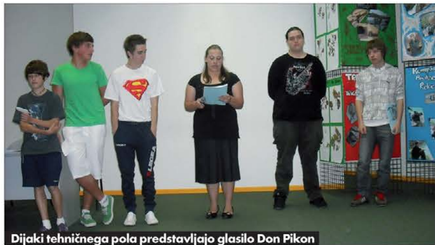
Dijaki tehničnega pola predstavljajo glasilo Don Pikon

najdljive in požrtvovalne dijake ter profesorje šolskega zavoda Cankar. Za njimi so svoja dožnanja ob projekciji videoposnetka prikazali dijaki bienija DITZ Jurij Vega in DTTZ Ž. Zois. V sodelovanju z italijanskimi vrstniki šole ITAS D'Annunzio so v sklopu načrtovalnega področja, ki je obvezno za zavoda Ž. Zois