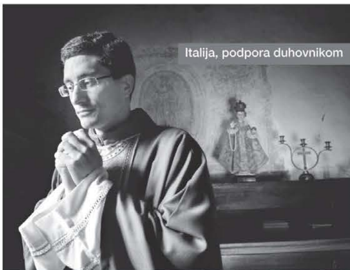
Italia, podpora duhovnikom