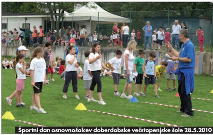
Športni dan osnovnošolcev doberdobske večstopenjske šole 28.5.2010

NOGOMET Elitna liga - play-off. Prva finalna tekma Kras - Jesina 3:0