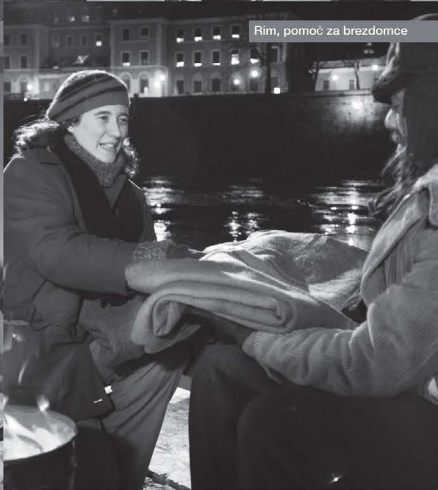
Rim, pomoč za brezdomce