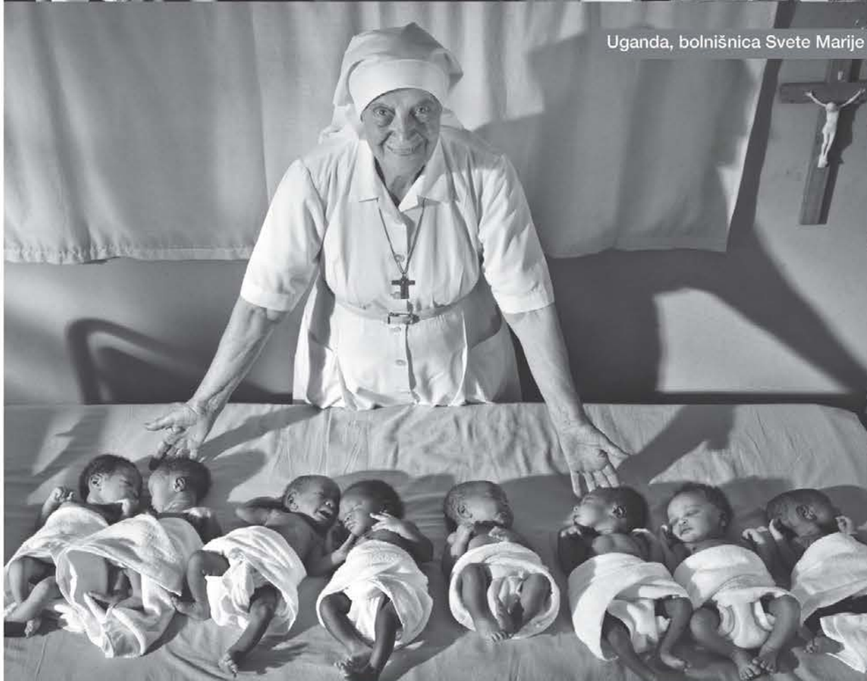
Uganda, bolnišnica Svete Marije