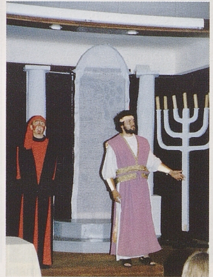
Prizor iz igre Savlov demon.