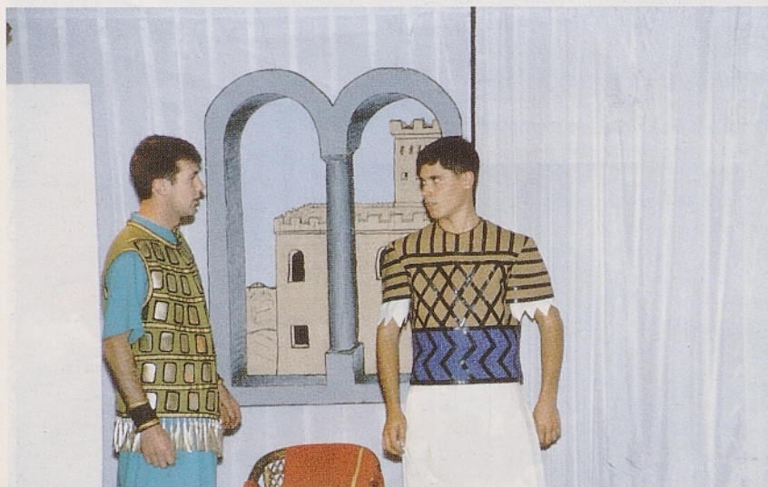
Gledališka skupina iz Selc pri Škofji Loki je v klubu predstavila Rebulovo dramo Savlov demon.

OPOMBA: Stavak "Sam Juan Peron je ... zelo dobro ujemata Brazilija in ZDA" je vzeta iz knjige "Južna Amerika v današnjih dneh".