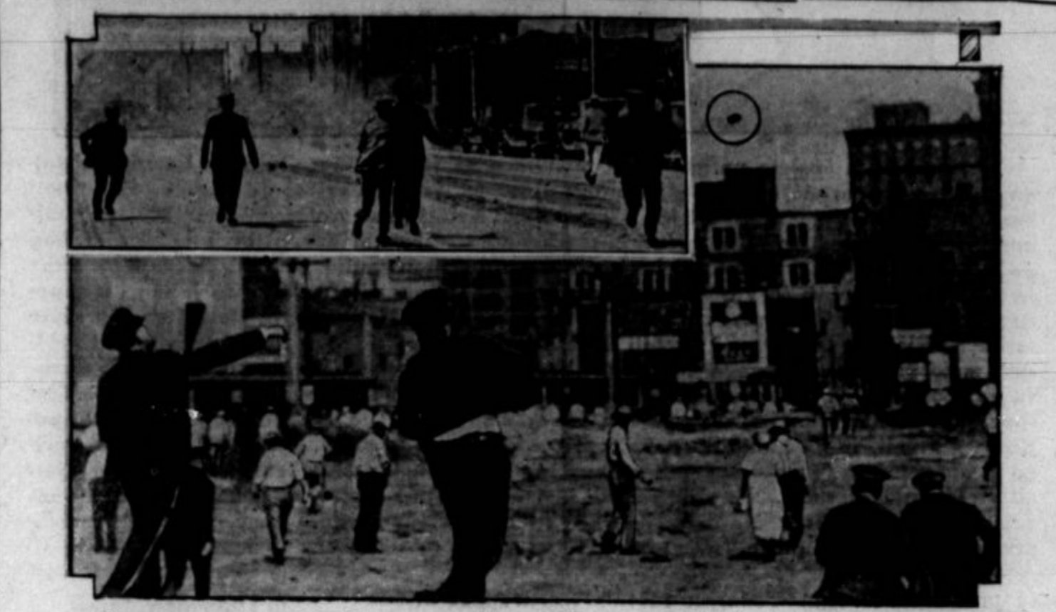
Demonstracije gladnih v ameriških mestih se nadaljujejo tudi skozi poletje, dasi jih lani ob tem času ni bilo. Nedavno so se dogodili izgredi brezposelnih delavcev v St. Louisu, Mo. Stirje so bili ubiti. Na tej sliki vidite, kako je policija razgnala demonstrante. Predsednik A. F. of L. Wm. Green, ki je konservativni unijski vodja, je na seji eksekutive omenjene federacije dejal, da niti kongres in ne posamezne države niso storile ničesar izdatnega v pomoč brezposelnim, katerih je zdaj že okrog dvanajst milijonov. Beda med njimi narašča in Green pričakuje, da se dogode prihodnje zimo izgredi bednih v vseh mestih. Tudi oblast jih pričakuje in je nanje pripravljena s policijo, vojaštvom, oklopnimi avti, bombami in strojnimi puškami.