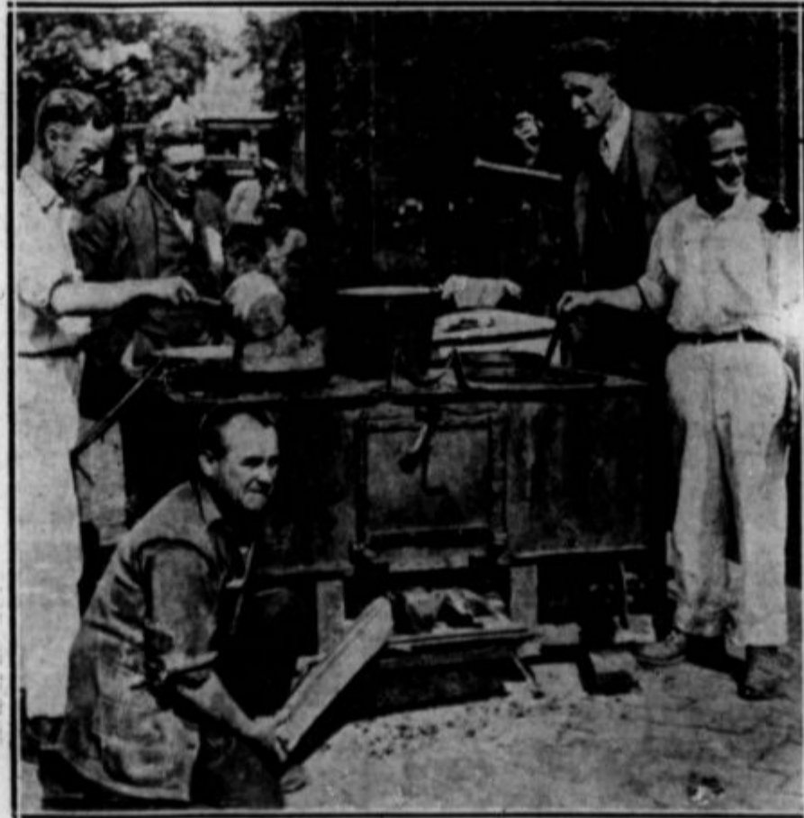
Uprava mesta Washington je 21. julija izdala ukaz, da se morajo podreti vse kolibe, ki so jih zgradili veterani na praznih stavbiščih. Dohli so si starih peč, zabojev, opeke od podrtih etavb, in si zgradili cele vase, ki pa so po mnenju washingtonskega mestnega žefa "pega na lepoti glavne-ga mesta."