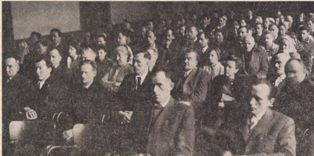
Pogled na del udeležencev 15. občnega zbora ZKP

že spet grozijo z izselitvijo!“ Kaj pomeni to? To ni nič drugega kot prišepetavanje od strani sovražnikov demokracije in sovražnikov miru, ki so spet na delu, da bi ustrahovali demokratične množice in tako