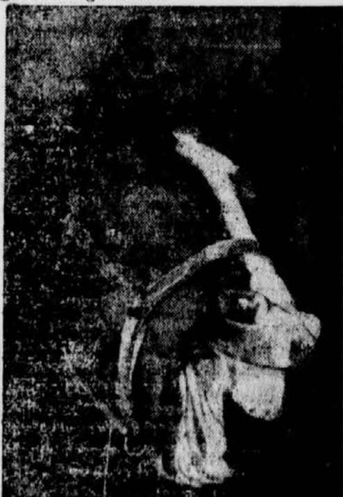
Lachen Pferde auch über Witze?

Bukarest, 13. Dezember. Das Blatt »Tempo« meldet, daß eine italienische Fi- nanzgruppe in Rumänien eine Fabrik zur Herstellung von Kunstwolle aus Milch zu errichten beabsichtigt. Mit Kunstwolle aus Milch wurden in Italien außergewöhnlich gute Erfolge erzielt.