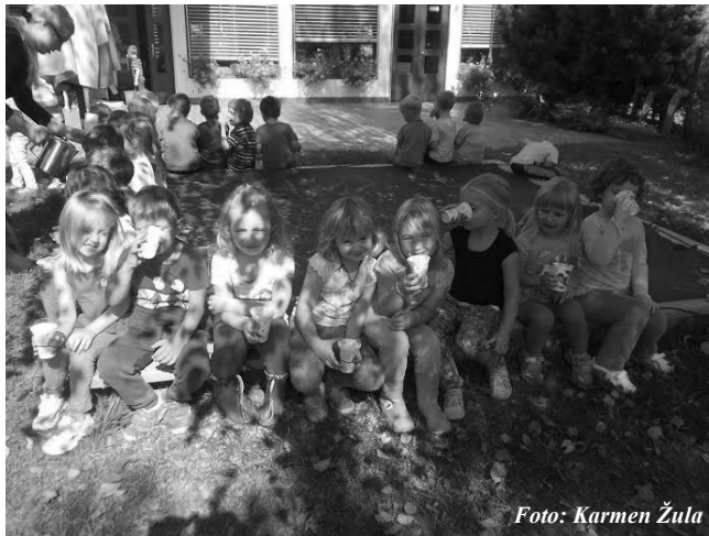
Sladkanje z grozdnim sokom in s kuhano marmelado

Trgatev je že od nekdaj veljala za vseslovenski praznik. Tako je jutranje meglice in jutranjo rososončece popilo ter grozdju polno sladkosti in zrelostipodarilo. Bližnji klopotec je 9. septembra 2014 priklical trgatev tudi v Vrtec Ivanjkovci. Naš mali nasad trte za vrtcemnam daje odlično priložnost, da še bolje spoznamo naravo, ki nas obkroža, še posebej pa tisto, kar nam narava daje. Zraven dobrot nam ponuja izjemno veliko možnosti za