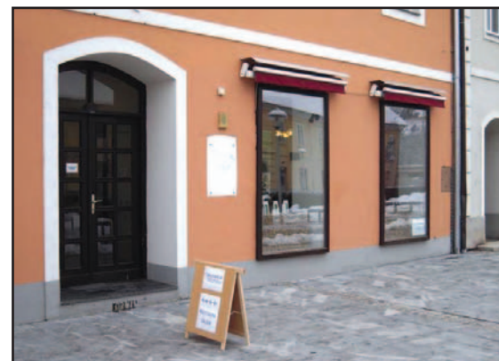
Stran 11: Zavod 100% BOTANIK