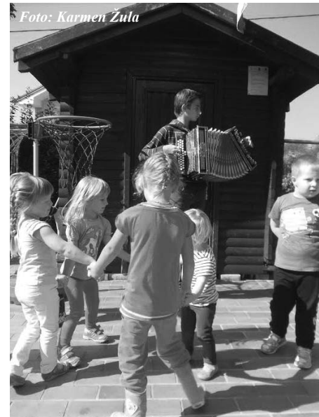
Ples s frajtonarico

čakale na sladko grozdje, male ročice pa so se začele takoj umivati in trgati grozdne jagode v veliko kad. Tako so v zadnji skupini poskrbele še za stiskanje sladkega soka, s katerim so se ob koncu otroci tudi posladkali. Seveda na naši trgatvi ni manjkalo »pütarov«, »bračov« in »frajtonarce«. Vzdušje je bilo zelo veselo, »huškalo« se je in plesalo, tako kot nekoč. Naš grozdni sok je nastal s pomočjo pridnih, delavnih rok v povezavi z navdušenjem in veseljem. Za konec smo grozdni sok skuhal, in tako je nastala prava grozdna sladka dobrota. Tudi tokrat se je izkazalo, da je narava