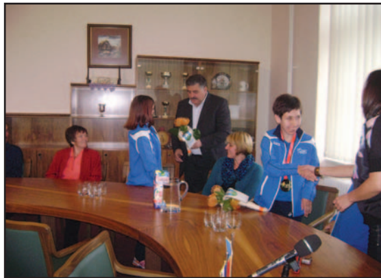
Stran 9: Specialni olimpijki na sprejemu pri županu