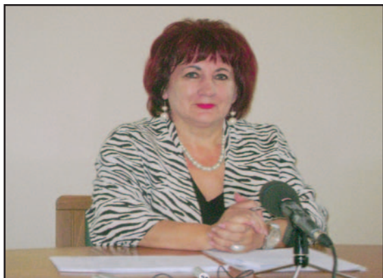
Stran 6: Varuhinja v Ormožu