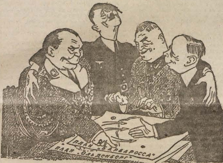
Načrte silne skupaj so kovali...