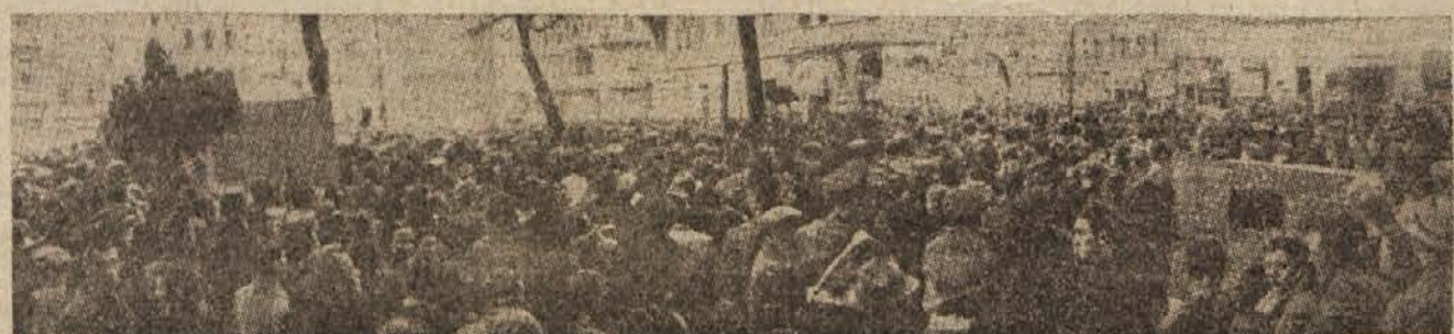
Nad 40.000 tržaških delavcev je 13. t. m. napolnilo do zadnjega kotička trg Garibaldi, kjer so mogočno manifestirali svojo enotnost in zahtevali ljudsko oblast, obnovo, delo in kruh. Revolucionarne pesmi, vzklili velikim voditeljem demokracije, Titu in Jugoslaviji, ki so odmevali po trgu, so dokazovali težnje tržaškega delavstva.

Predsednik je Manuilskega prepričal, da bo naloga tega pododboru pregledati veliko število dokumentov, od katerih pa večina sploh ne bo proučevana. Naravno je, da bodo poklicani predstavniki zainteresiranih držav ko se bodo ti dokumenti proučevali. Sestava pododboru je bila odobrena.