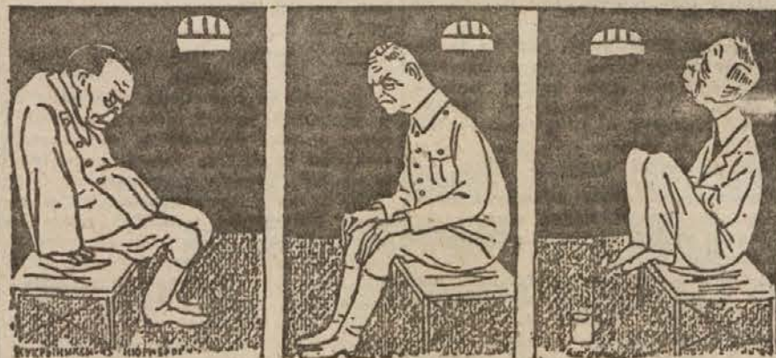
zdaj v celici vsak zase jih končali... (iz »Pravde«)