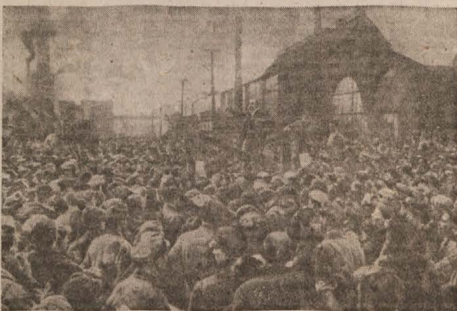
Lenin govori delavcem v Putilovskem zavodu oktobra 1917.

Leninova izjava ob začetku oborožene spopada: »Večina ljudstva je za nas.« je bila pravilna ugotovitev, ki je odločila usodo sveta. Zavzetej Zimsko palače je bil prvi, odločilni korak na poti, po kateri stopa odtlej sovjetski proletarijat od zmage do zmage. Slede mu ljudstva ostalega sveta.