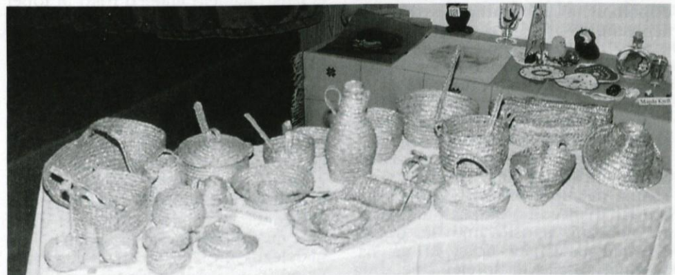
Razstava ročnih del v Krašnji