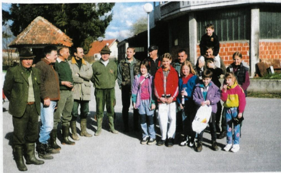
Lovci in otroci, ki so čistili za vami!

Kadar ni zlobe in zavisti je srečna mladost in starost