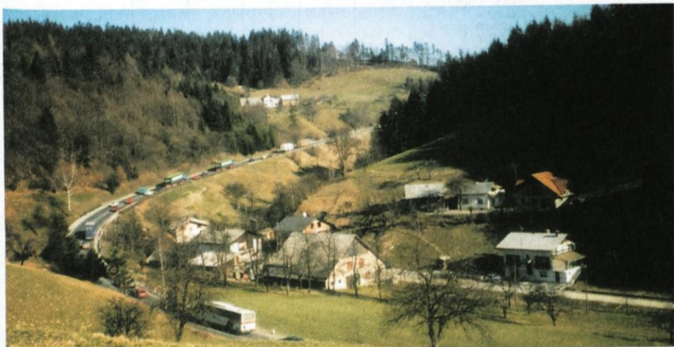
Proti Trojanam se zaradi del na viaduktu Baba tudi ob sobotah valijo počasne kolone