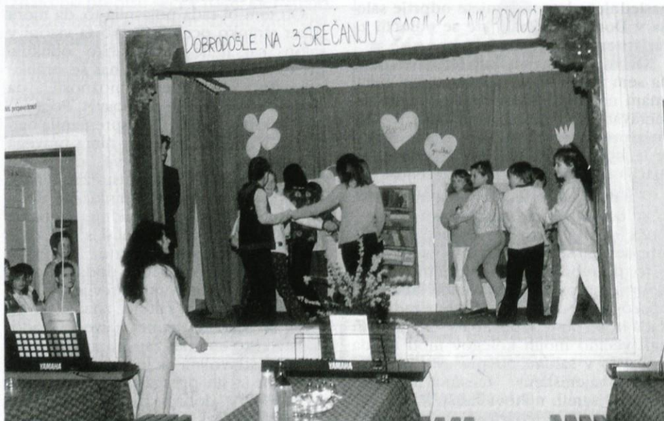
Zaigrali in zaplesali smo jim