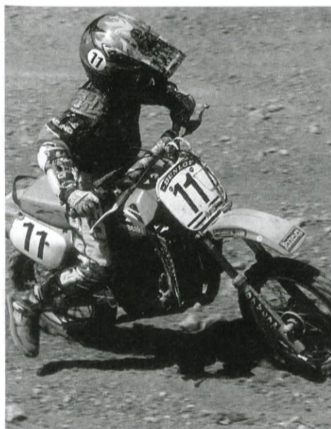
Spretnosti Klemnu ne manjka