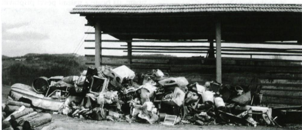
Pod vasjo Trnovče so lovci nabrali kar veliko...