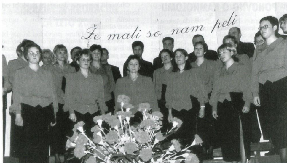
Materinski dan v Lukovici