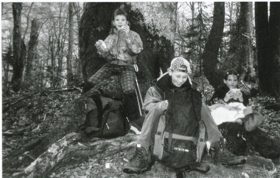
Počitek pri vzponu na Komno