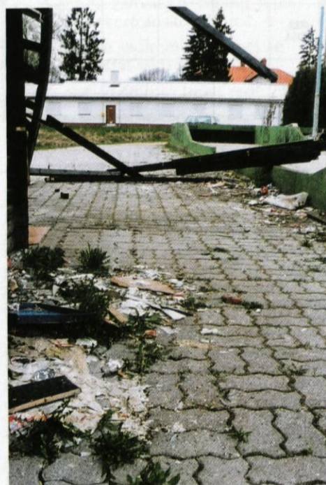
»Urejena« balinišča in bife v Šentvidu