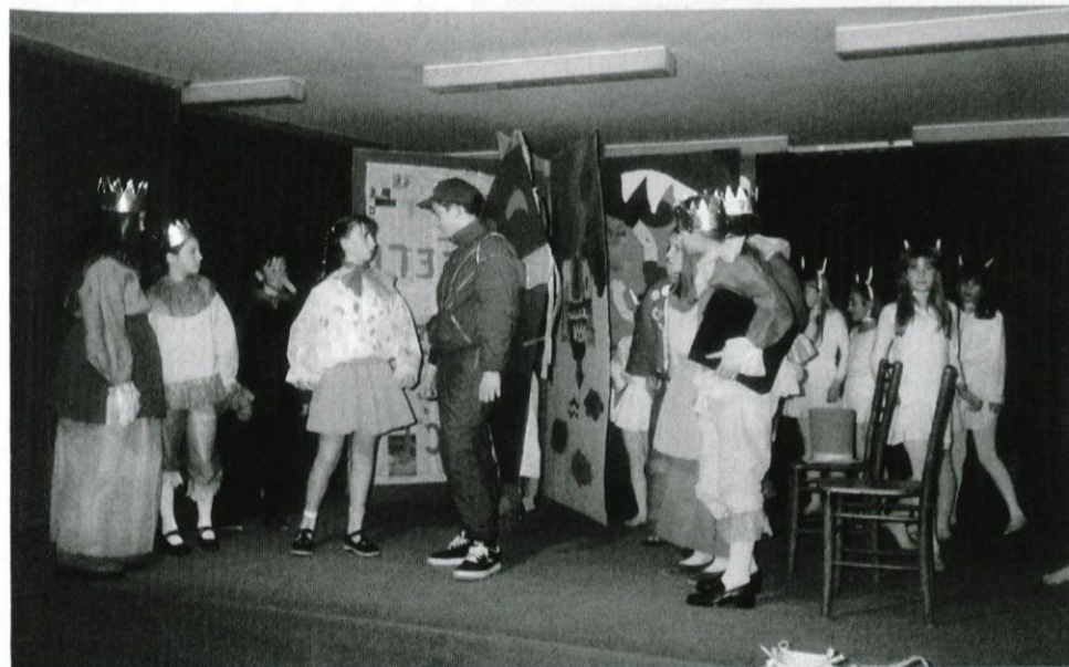
Na področno srečanje