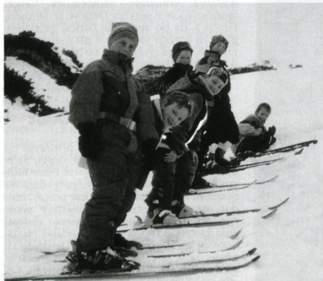
Tako se je začelo naše prvo turno smučanje

Ob 8,00 smo vstali, se oblekli in igrali karte. Čez nekaj časa smo šli na zajtrk. Ob 10,00 smo se odpravili na prvo turno smuko. Startali smo na Kraju in se odpravili proti Bogatinskemu sedlu. Pri drugi markaciji za turne smučarje smo se spustili v dolino in se po drugi poti vrnili nazaj na Kraj. Tam smo naredili skakalnico in nekaj časa skakali. Potem smo šli na kosilo. Za kosilo smo imeli zelje, meso in »tenstan« krompir. Po kosilu smo imeli počitek. Med počitkom je komisija ocenila sobe. Čez nekaj časa smo šli delat iglu. V narejenem igluju smo zapeli pesem. Potem smo šli zopet skakat. Spet so padali novi rekordi. Ko smo prišli v kočico, smo se preoblekli in dali mokre obleke sušit. Pred večerjo smo imeli še analizo ture in zapisali smo v knjižice.