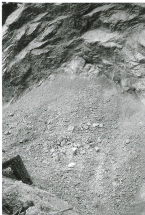
Kamnom v Podmilju