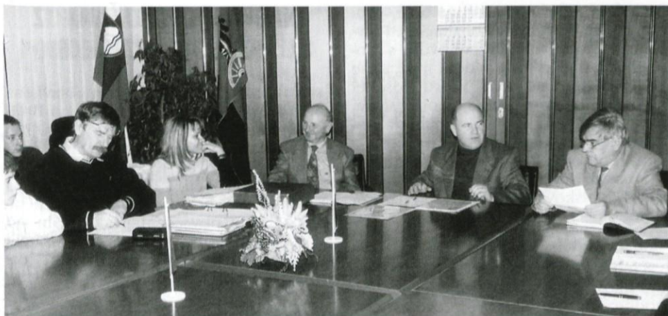
Občini zbor godbe Lukovica