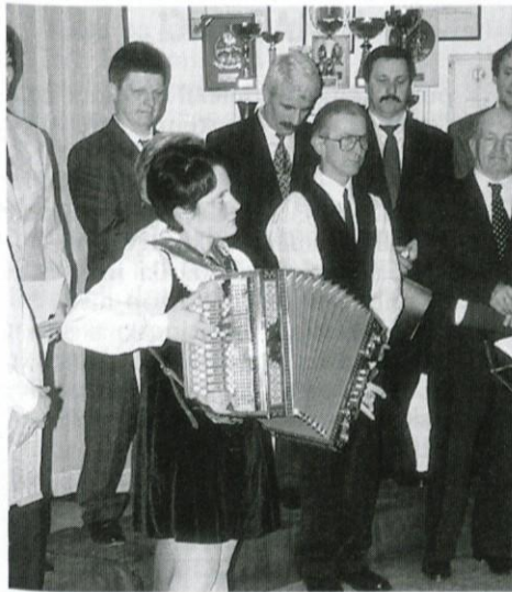
Materinski dan v Krašnji