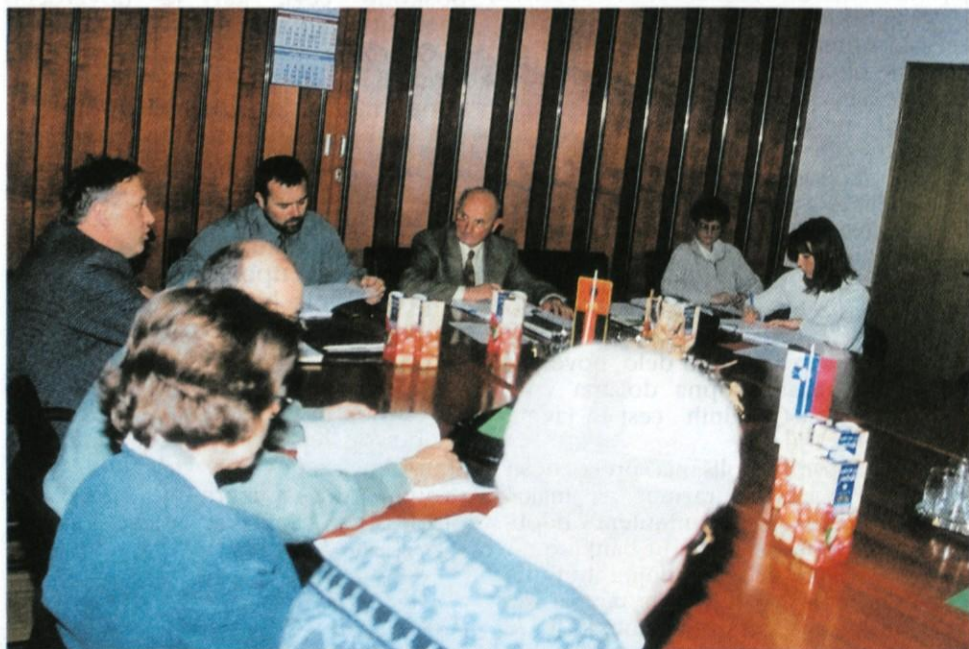
Seja občinskega sveta, marec 2000

Sprejet je bil tudi program kulturnih prireditev občinskega pomena v letošnjem letu; do konca leta bodo tako iz-