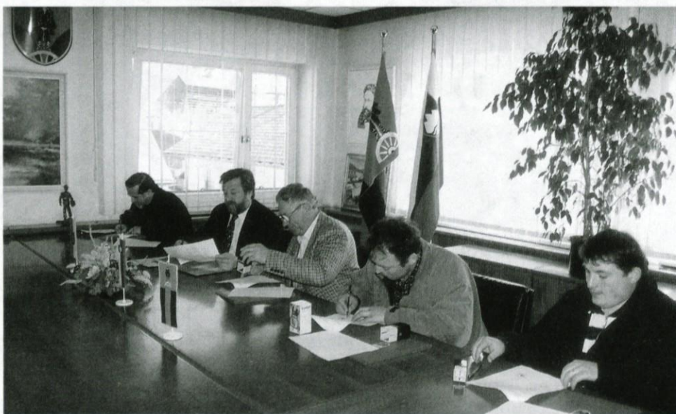
Podpis pisma o nameri