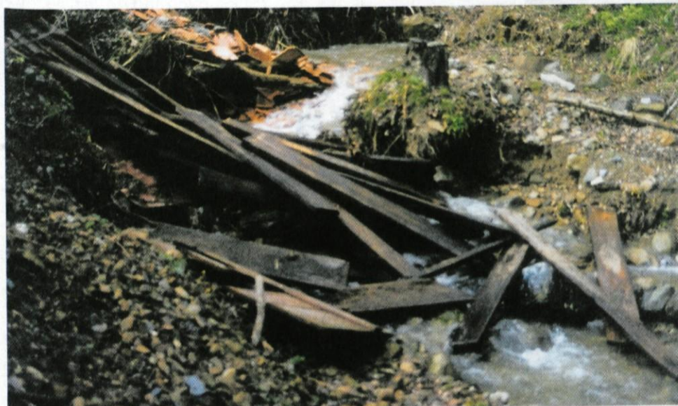
Odpadki v vodi