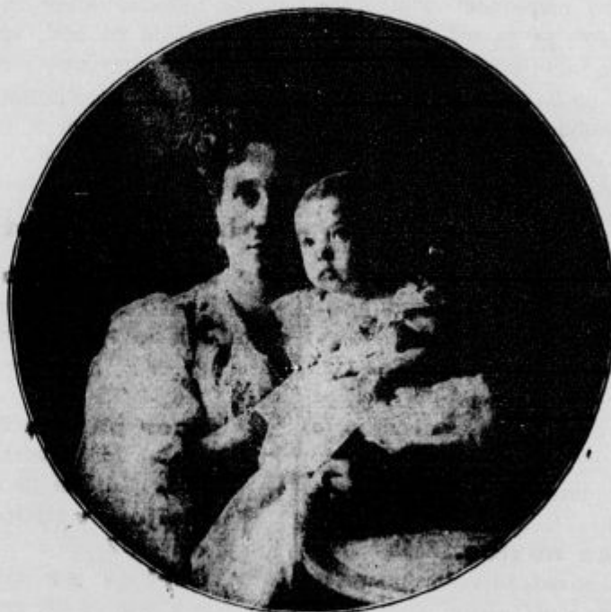
Ruska carinja Aleksandra z mladim prestolonaslednikom Aleksejem Nikolajevičem.