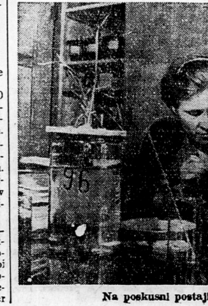
Na poskusni postaji »Akademik N. Rudnik«

Doslej so obnovili nad 20.000 kolhozih laboratorijev, ki so ustavili delo med vojno. Te postaje, ki ugotavljajo na določene krajevne okoliščine različne nove kmetijske metode, preskrbujejo znanost z mate-