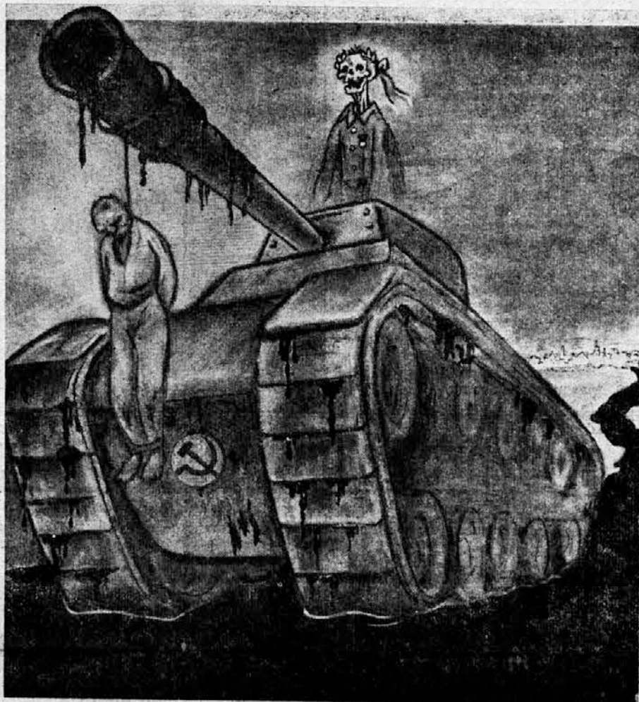
EDINI IN GLAVNI KRIVEC (POZNANJSKE VSTAJE)

Nenni se torej še vedno ni izjasnil v vprašanju, ki je odločilne važnosti: ali bo podrli mostove, ki ga vezujejo s totalitarnim komunistično stranko ter bo tem izpričal svojo voljo, da bi bil član demokratskega tabora. Na eni strani pravi, da bi rad spravil katoličane na levo, nato zopet, da je treba razbiti sredino. V kolikor mu niso takšne izjave potrebne, da prepelje v novo socialistično stranko čim kompaktnjši del svojih dosedanjih pristašev, je to presneto nevarna zadeva, pred katero morajo biti pozorni ne samo socialisti demokrati, temveč tudi ostale sredinske stranke.