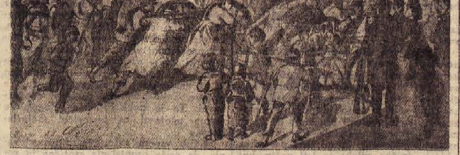
Naskok na grič Montmartre v Parizu, kjer so se pariški revolucionarji l. 1871 polastili znamenitih topov in kjer so prvič v zgodovini človeštva postavili revolucionarno proletarsko oblast.