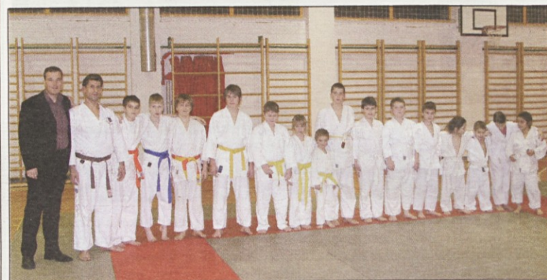
Casabeli Piran za darilo.