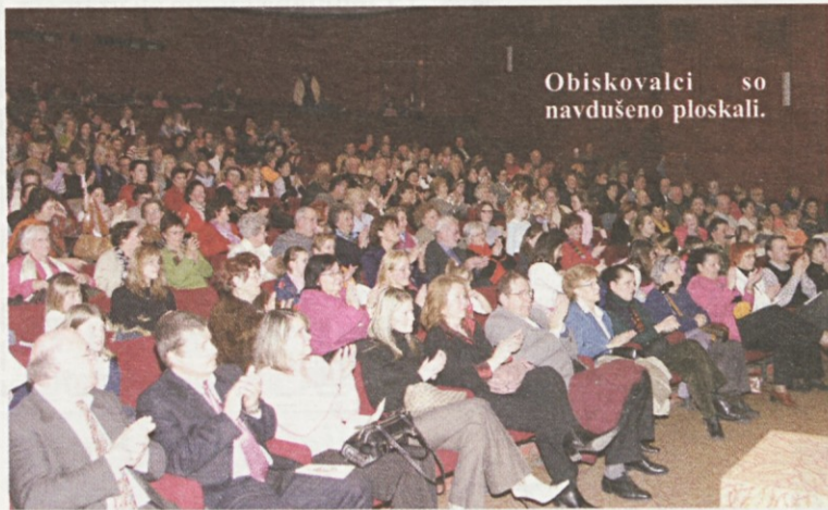
Obiskovalci so navdušeno ploskali.