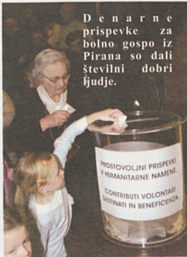
Denarne prispevke za bolno gospo iz Pirana so dali številni dobri ljudje.