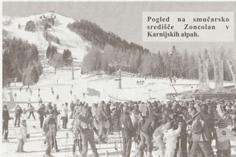
Pogled na smučarsko središče Zoncolan v Karnijskih alпах.

Občina Sutrio je za revitalizacijo znanega smučarskega središča Zoncolan - gradnjo sodobnega hotela – pridobila že 4 milijone evrov evropskih sredstev, za posodobitev infrastrukture pa pričakujejo še milijon evrov. Prvi stiki s predstavniki Občine Izola o tesnejšem sodelovanju. Odlična zimska sezona in pravi mali raj tudi za slovenske smučarje. Na letošnjem tekmovanju za pokal Banke Koper lovorika Smučarskemu klubu Portorož.