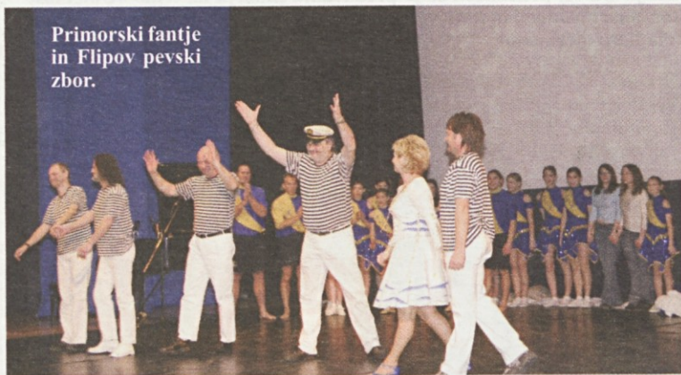
Primorski fantje in Flipov pevski zbor.