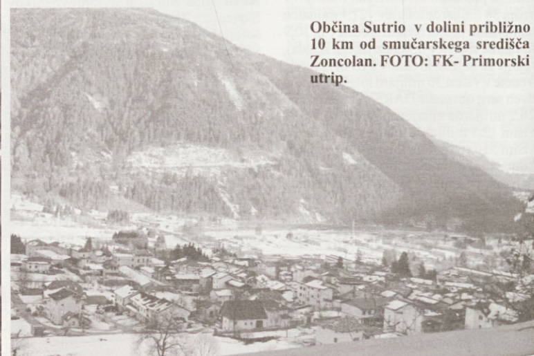
Občina Sutrio v dolini približno 10 km od smučarskega središča Zoncolan.