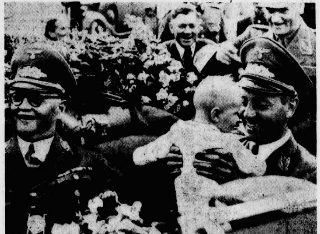
Herzlich ist die Begrüßung des Reichsleiters und des Gauleiters auf der Fahrt durch das Unterland