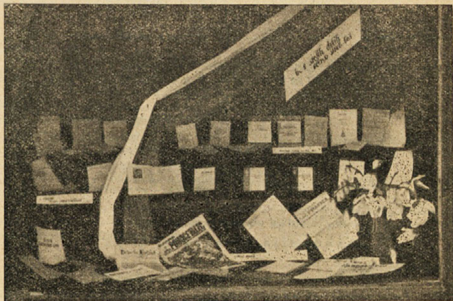
Spominska razstava Borisa Kidriča v izložbi trgovine »Izbirac« v Novem mestu od 12.—20. IV. 1953

U počastitev prezgodaj umrlega voditelja narodnoosvobodilne borbe v Sloveniji,