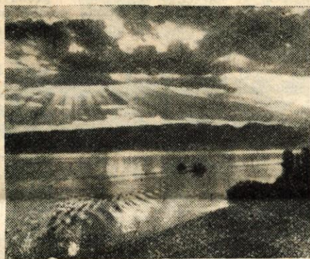
Večer na Prespanskem jezeru, enem najlepših makedonskih jezer

Dupljski grad sam na sebi ni nobena posebnost. Leži na ravnini in ni bil nikdar utrjen, kot je razvidno iz izvorne slike in Valvasorjevi zgodovini. Prvotno dvonastropno zgradbo so po požaru 1832 znižali za eno nadstropje in obenem skrajšali na vzhodnem koncu za eno tretjino. Danes predstavlja navadno enonastropno kmečko hišo, ki ji je ostalo ime Vojvodov grad. Vidna je še grajska temnica in celica za stražo. Hiši na desno, kjer so bili svojčas grajski hlevi, pravijo pri Stalarju, sosedu na levi, kjer je bila grajska kašča (fišterna), pa pri Fištru. Tudi ledinska imena Ribnik in Na šetni spominjata na imenitnost lastnikov tega gradu.