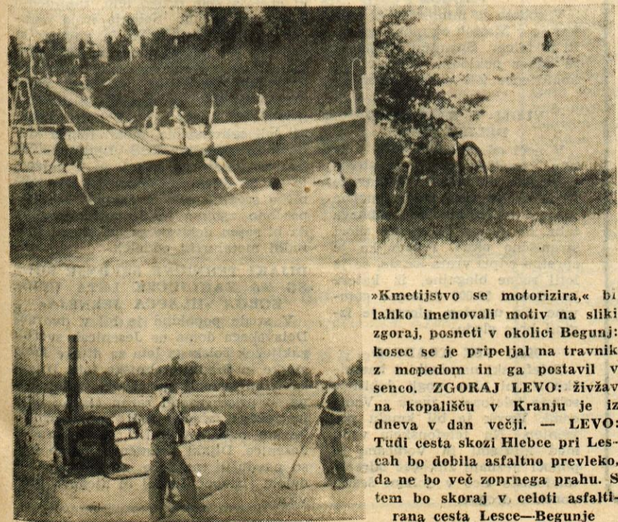
»Kmetijstvo se motorizira,« bi lahko imenovali motiv na sliki zgoraj, posneti v okolici Begunj: kosec se je pripeljal na travnik z mopedom in ga postavil v senco. ZGORAJ LEVO: živčav na kopališču v Kranju je iz dneva v dan večji. — LEVO: Tudi cesta skozi Hlebce pri Lescah bo dobila asfaltno prevleko, da ne bo več zoprnega prahu. S tem bo skoraj v celoti asfaltna cesta Lesce—Begunje