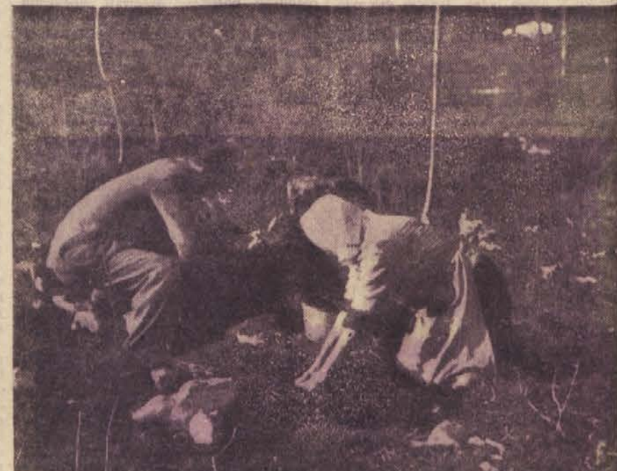
V nedeljo so slušateljci oblasne partijske šole, tečajniki oblasnega rgovskega tečaja in člani množičnih organizacij iz Postojnskega posadili s smrekicami in jelkami goličave na »Raubarkomandije« v gozdni upravi Planina

Da bi prihranili devize, so naši strokovnjaki izdelali načrte za napravo. Pod njihovim vodstvom so delavci tudi demontirali staro napravo. Izdelavo nove naprave so prevzeli delavci tovarne »Djuro Djaković« v Slavonskem Brodu. V petih mesecih so opravili veliko nalogo. Za kako veliko delo gre, sprevidimo že, da je bilo treba za ves obrat nad 150 ton železa.