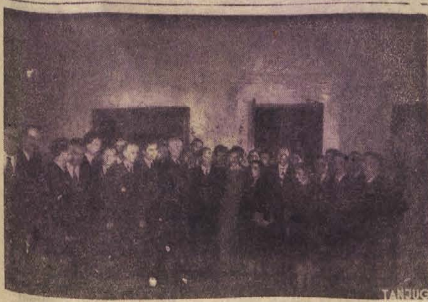
Zastopniki inženirjev in tehnikov na sprejemu pri maršalu Titu

Ministrstvo za kmetijstvo LR Slovenije je pozvalo po oblastnih ljudskih odborih, naj zberejo podatke o primernih