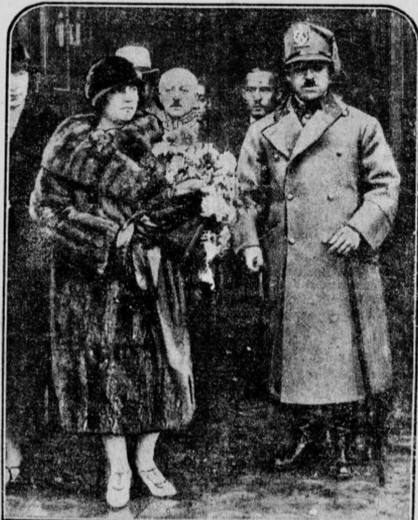
Afganistanski kralj Ahmanulla in kraljica v Parizu.

več kot 1000 konvertitov. Od ostalih ne šteje razen ene izjeme nobena škofija manj kot 300 konvertitov. Katoliška cerkev pa je narasla v letu 1926 skupaj s konvertiti za 87.445 duš. Vseh katolikov