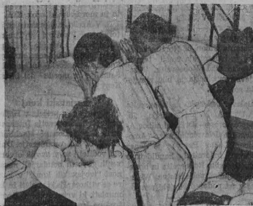
Na sliki je skupina angleških otrok, ki molijo pred nočnim počitkom v zahvalo, ker so se srečno prepeljali preko oceana v Ameriko.

rekel: "Ako dovolite..." ter se pri tem proseče ozrl na neka vrata.