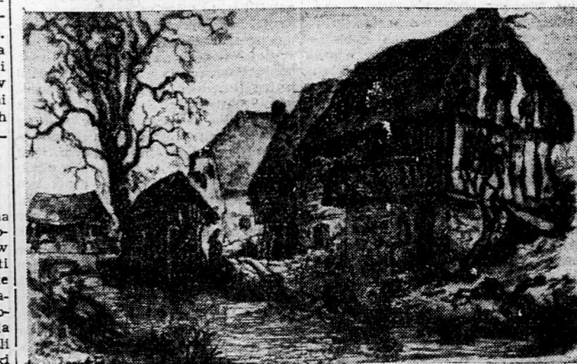
Vladimir Lamut: Teški potok pri Šmihelu, akvarel