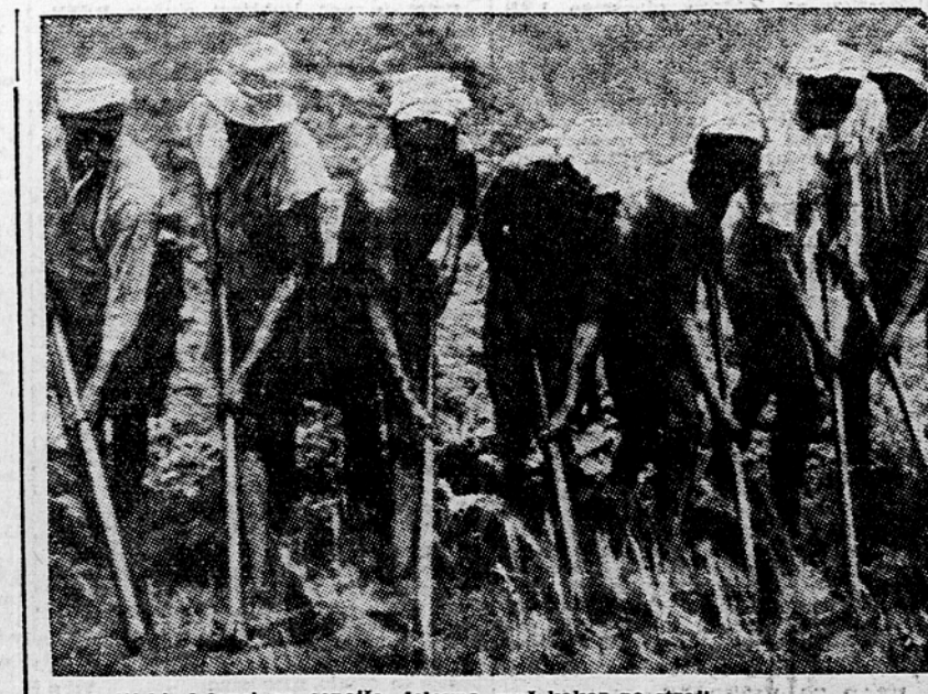
Indijski delavci so cenejša delovna moč kakor pa stroji

Indijski politični voditelji so se že v času angleškega gospodstva dobro zavedali, da je prav zemljiško stanje vzrok nečloveškega trpljenja indijskih kmetov. Znano jim je tudi dejstvo, ki so ga že dostikrat poudarjali; dežela