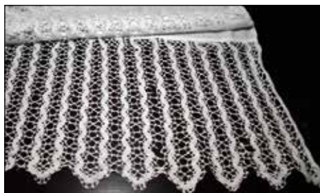
Čipke, ki so jih z albe premestili na prt.

Prt z rešilje vezeno je najtežje zlikati. Moram ga ravno prav navlažiti in ko ga likam, moram vezeno močno raztegovati, razvleči, da se dobro zlika. Vsako zmečkanino moram ponovno navlažiti in vztrajati, da je blago gladko zlikano. Vztrajnost in potrpežljivost sta poplačani, saj je prt kot "nov".