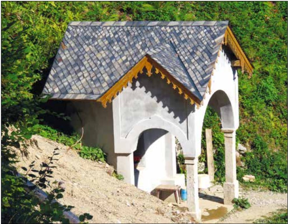
S skrilom krita streha kapelice Marije Brezmadežne v Suši je nekaj posebnega, tako barve skrila kot linije.

Zadnjo sem pokrtil streho čebelnjaka pri Žnidarjevih. Delal sem "ta nemško", to pomeni, da sem uporabil velike plate skrila.