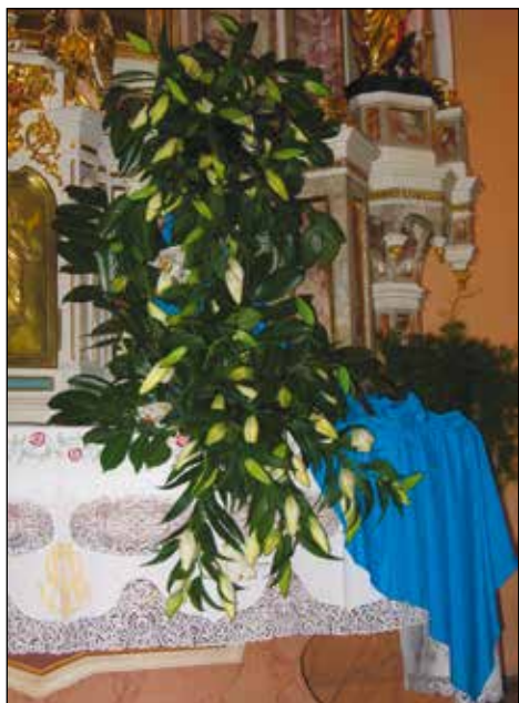
Lilije so čudovite, a zahtevne. Na Marijinem oltarju leta 2009 ob blagoslovu obnovitvenih del v cerkvi sv. Antona Puščavnika.

danes in je daritveni oltar sredi prezbitarija. Poznati sem moral liturgičen pomen priložnosti ali dogodka kot tudi izbranega motiva, saj je moja stvaritev morala biti liturgično povezana.