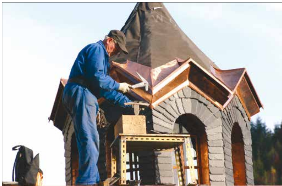
Pokrivanje kupole na cerkvi Loretske Matere Božje v Suši.