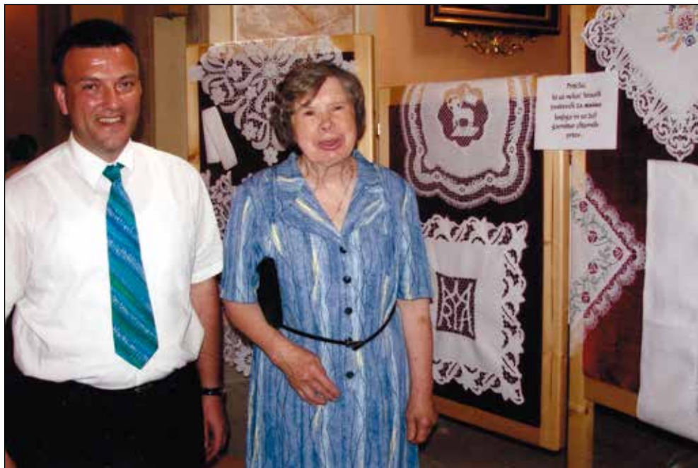
S Špendalovo Tončko sva velikokrat sodelovala. Vedno je bila pripravljena zalivati moje stvaritve.