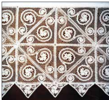
Klekljan prt s tulipani, ki je zelo občutljiv, a čudovit.