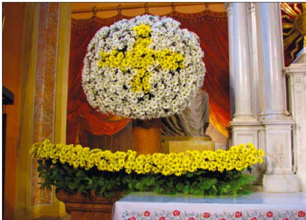
Glavni oltar cerkve sv. Antona Puščavnika za prvo sv. obhajilo leta 2009: hostija iz mnogocvetnih marjetic.