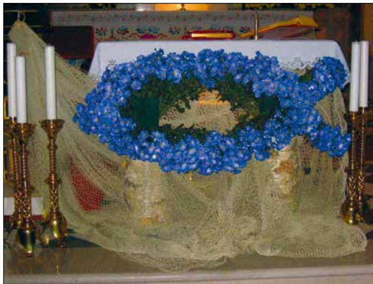
Glavni oltar cerkve sv. Antona Puščavnika leta 2009 ob blagoslovu obnovitvenih del.

Nekatere kreacije so izzvale pravi vav-odziv, kraveči roki sta ena izmed teh. Nekateri so, ker so vedeli, da krasim, prišli večkrat vmes pogledat, kako je moja stvaritev nastajala. Drugi spet so me že vnaprej spraševali, kaj nameravam ustvariti ... Različno. Moram povedati, da je bil župnik Dular izredno razumevajoč in ga je zanimalo, kaj sem ustvaril in zakaj. Pokazal in razložil sem mu svoj načrt ter zgodbo, kaj me je navdihnilo. On je moj motiv, moja