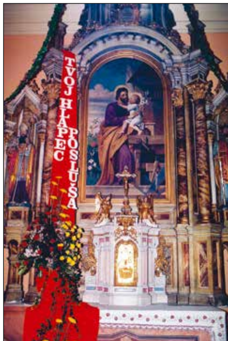
Davidovo novomašno geslo, drugi del.