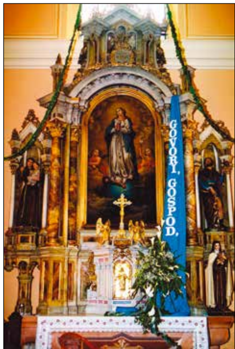
Davidovo novomašno geslo, prvi del.

Obema sem okrasil cerkvi, kjer sta se poročila. Na Jamniku sem jo okrasil za brata Renata z rdečimi