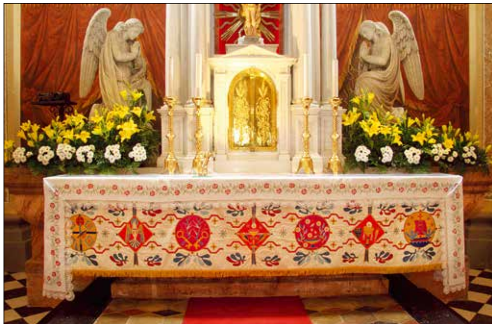
Prt sedmih zakramentov.

Najpomembnejši vzrok je v tem, da je bilo klekljanje nekoč način preživetja. Mnogo družin se je preživljalo s klekljanjem in klekljale niso samo žene, tudi moški in otroci. Vse čipke in vezenine, vsi cerkveni prti so bili izdelani in podarjeni v zahvalo. Žene in