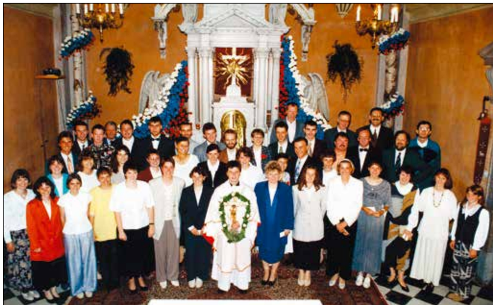
Sodelujoči v programu Simonovega novomašnega praznovanja.

Gledališka skupina je takrat delovala v okviru Mladih krščanskih demokratov (MKD). Za novo mašo smo študirali igro, ki smo jo nameravali odigrati v sklopu programa Simonovega praznovanja. Vedeli smo, da je vsi ljudje ne bodo mogli videti, ker vsi ne bodo povabljeni na praznovanje ob novi maši. Zato