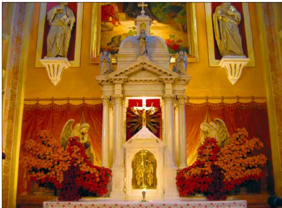
Skulpturo je navdihnila postna pesem Strašno trpiš.