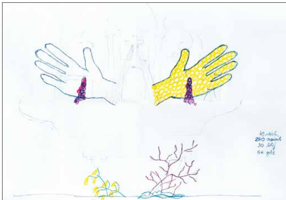
Narisal sem načrt, za npr. krvaveči roki, da sem lahko preštel, koliko cvetov potrebujem in izračunam stroške. Pomagalo mi je tudi, da sem lažje izdelal skulpturo in se nisem ponavljal.