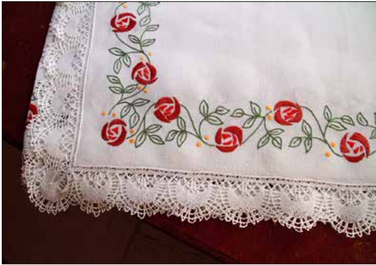
Najljubši komplet prtov, pri njihovi izdelavi je sodelovala tudi Tončka.