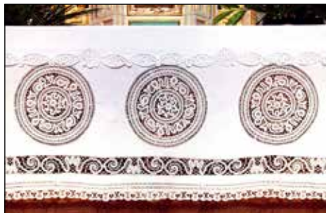
Klekljana mojstrovina, ki jo je težko zlikati v prvotno obliko.

Po letu 1977 ali 1978. Prej so zanje skrbeli Mežnarjevi, družina Blaža in Franciške Gortnar.