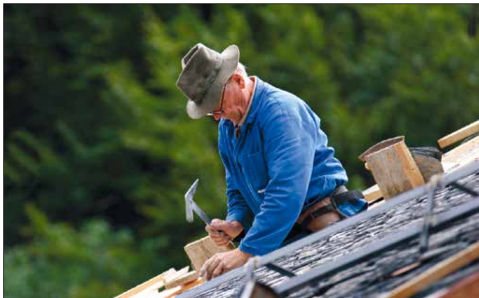
Pokrivanje nove strehe s skrilom.