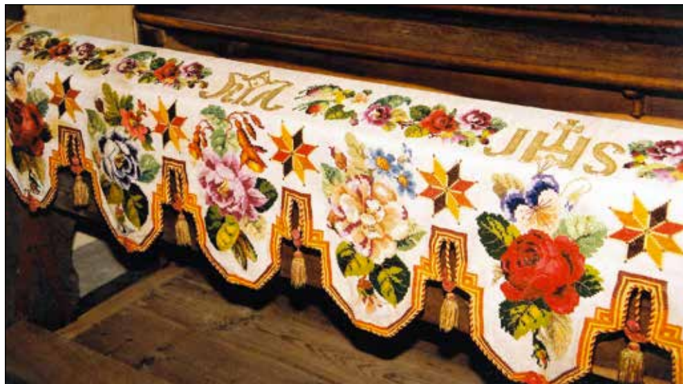
Najstarejši vezen cerkveni prt v župniji Železniki.

Z njim in s prtom, ki je narejen iz trikotnikov s tulipani, moram res previdno ravnati. Operem ju na roke v škafo, ju polijem z vrelo vodo, z lugom, previdno "operem", splaknem, zelo previdno ovijem, dodam štirko in narahlo ovijem. Ko se skoraj posušita, ju zelo previdno zlikam, da ne poškodujem čipk. Vendar so čipke klekljane iz zelo kvalitetnega sukanca in tudi