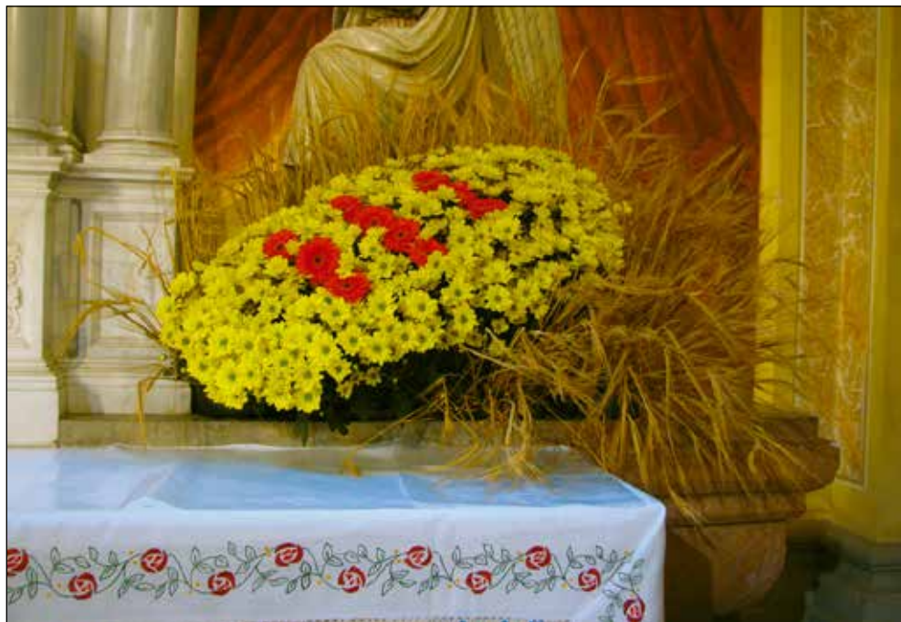
Glavni oltar cerkve sv. Antona Puščavnika za prvo sv. obhajilo leta 2009: kruh iz mnogocvetnih marjetic.