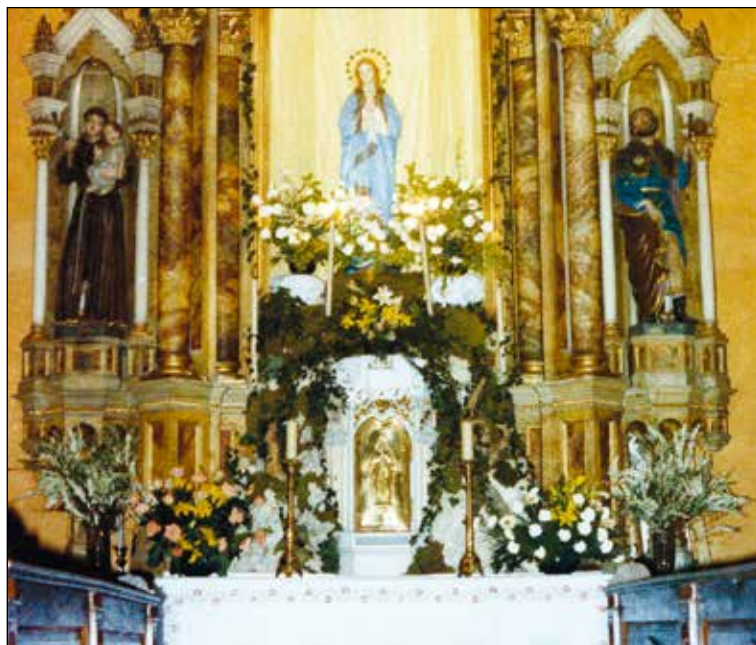
Majnik, kot smo ga poznali pred obnovo cerkve sv. Antona Puščavnika.

Res je. Spominjam se svojih začetkov, ko sem hotel posnemati kaplana Selana, ki je uporabil gladijole,