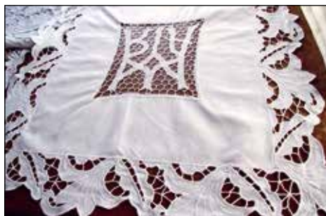
Najtežje je zlikati prt z rešilje vezenino.

Prt, ki je bil klekljan za Marijin oltar z okroglimi čipkami, ki so zelo bogate, zelo gosto klekljane. Ko ga operem, vse "vleče", čipke so povsem nagubane, zmečkane. Vzrok je zahtevna tehnika klekljanja kot tudi zapleten vzorec čipke, ki otežita likanje. Čipke moram ob likanju sproti ravnati, močno "raztegovati", da prt spet dobi prvotno obliko.