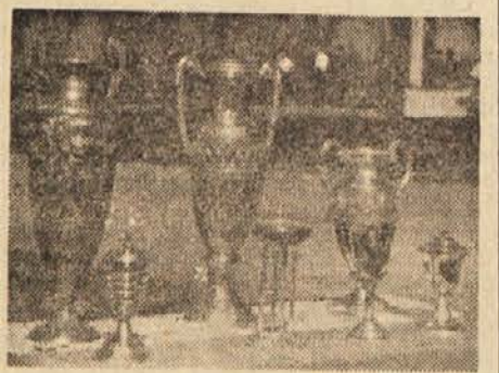
Pokali za zmagovalce v posameznih panogah

Člani: Lokomotiva (Zagreb): Zeleznikar (Beograd) 3:0; Zeleznikar (Maribor): Zeleznikar (Ljubljana) 3:2.