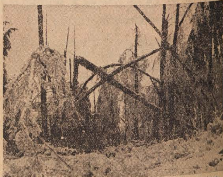
Tako sta gospodarili letošnja zima in burja na Primorskem

V počastitev Titovega rojstnega dneva bo tudi letos meseca maja v Tolminu okrajni mladinski festival, ki je postal skorajda že tradicionalen. Na lanskem festivalu je v okviru priprav za proslavo na Okroglici sodelovalo preko 3000 mladincev in pionirjev. Računajo, da udeležba na festivalu tudi letos ne bo manjša. Na okrajni mladinski konferenci so tudi sklenili da se bodo v osnovnih organizacijah čimprej pričeli nanj pripravljati. Podobno kakor prejšnja leta bodo najprej občinski festivali, nato pa se bo mladina iz celega okraja zbrala v Tolminu za skupni nastop.