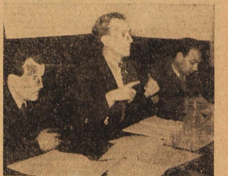
Predsedstvo odbora za gospodarstvo Zveznega sveta Zvezne ljudske skupščine