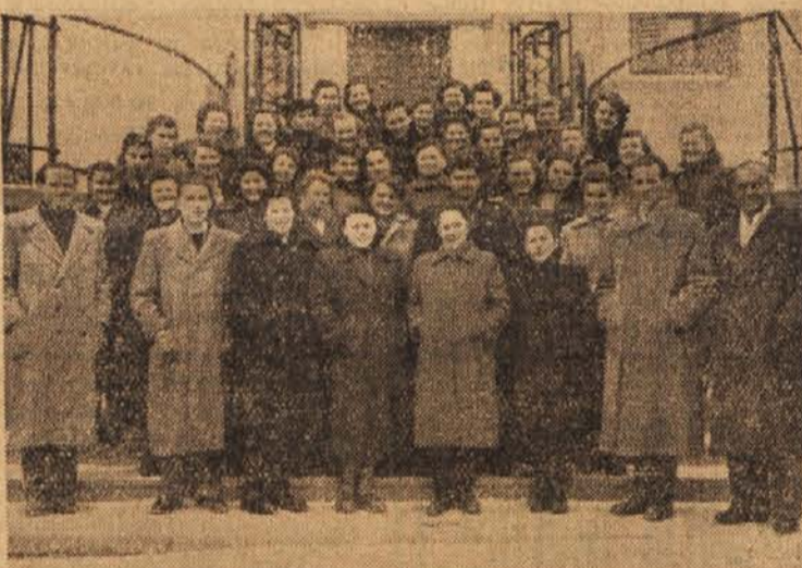
Obiskovalci tečaja RK v Cerknem

Na občnem zboru so izvolili tudi zadrufnega ljudskega tožilca in naročili novemu upravnomu odboru, da naj vskladi zadrufna pravila z novo uredbo o kmetijskih zadrugah. J. O.