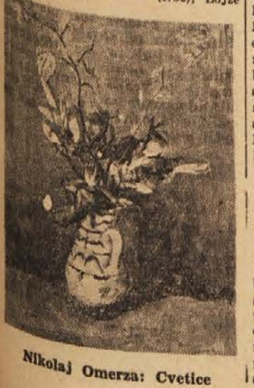
Nikolaj Omerza: Cvetice