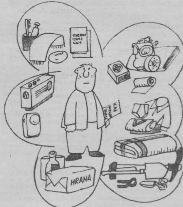
Zaščitna sredstva so najnujnejše, kar imejmo vselej pri roki.

Pregledati je treba centralne ventile vodovodnih in drugih instalacij v hiši in s tem, kje so in kako se z njimi ravna, seznaniti vse pripadnike hišne enote civilne zaštite, da bi jih v primeru potrebe lahko vsakdo od njih zaprl.