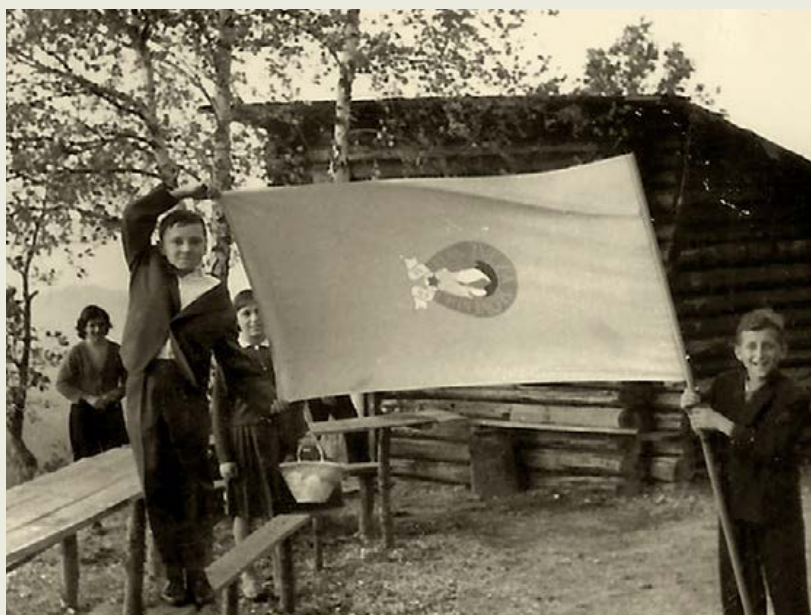
Mladinski odsek PD Šentjur z zastavo PZS leta 1960

Idejo o večjem planinskem domu so udeležili z začetkom gradnje leta 1961. Ta letnica sovpada z dvajseto