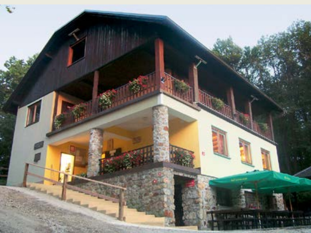
Planinski dom na Resevni danes Arhiv PD Šentjur

Ena prvih razglednic Planinskega doma na Resevni Arhiv PD Šentjur