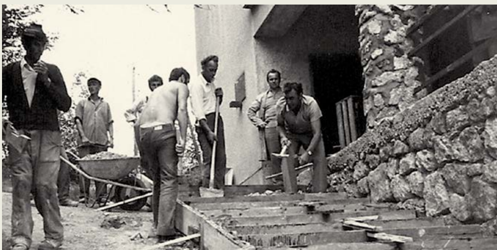
Udarniška akcija pri domu na Resevni Arhiv PD Šentjur

obletnico ustanovitve I. celjske čete na Resevni, zato je bila prva prireditev namenjena tudi spominu na ta dogodek. Gradnja doma je potekala kar dvajset let. Uradno odprtje je dom dočakal 20. septembra 1981, urejen srednji del, ki je nudil zatočišče obiskovalcem, pa so odprli leta 1963. Planinski dom na Resevni je bil, kot številne druge planinske kočice po Sloveniji, zgrajen udarniško. Pri njegovi gradnji so sodelovala različna šentjurska podjetja, organizacije, društva in šole; postal je vsešentjurski projekt, ki je združil občane in ljudi širše. Prav tako je bil tudi medgeneracijski projekt, saj so učenci šol šentjurske občine pomagali pri utrjevanju cest in pri gradnji objekta. Tako so na veliki mladinski akciji med letoma 1961 in 1963 učenci nosili na Resevno zidake. Vsaka šola naj bi imela športni dan, na katerem bi učenci simbolično ponesli vsak svoj zidak na Resevno. Otroci so prišli do vznožja hriba, kjer so prejeli zidake, in se nato povzpeli na hrib. Veliko zgodb je, kako sta po dva učenca s pomočjo fižolovke nosila zidake na mesto postavitve doma. Bili so ponosni na svoj dosežek, s takimi dejavnostmi pa se je pripadnost mlajših generacij domu in Resevni še povečala.