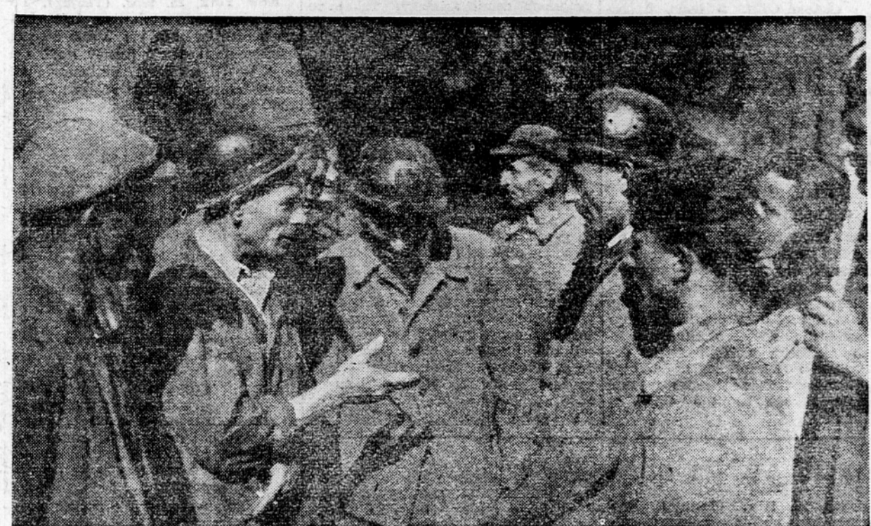
BOSANSKI RUDARJI POZIVAJO NA PREDVOLIVNO TEKNOVANJE SLOVENSKE RUDARJE