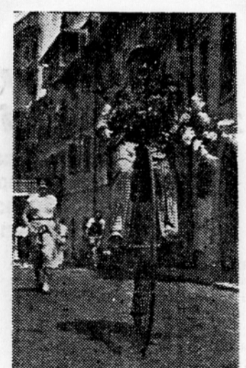
Se danes se dobro počuti na njem, samo na ovinkih mu gre slabo ker so ceste preozke

Hvala smo tov. Korniču, da se je takoj odzval našemu povabilu, ter s svojo razstavo privedel res lep in redek užitek bolnikom in osebam inštituta za TBC na Golniku. Z. J.