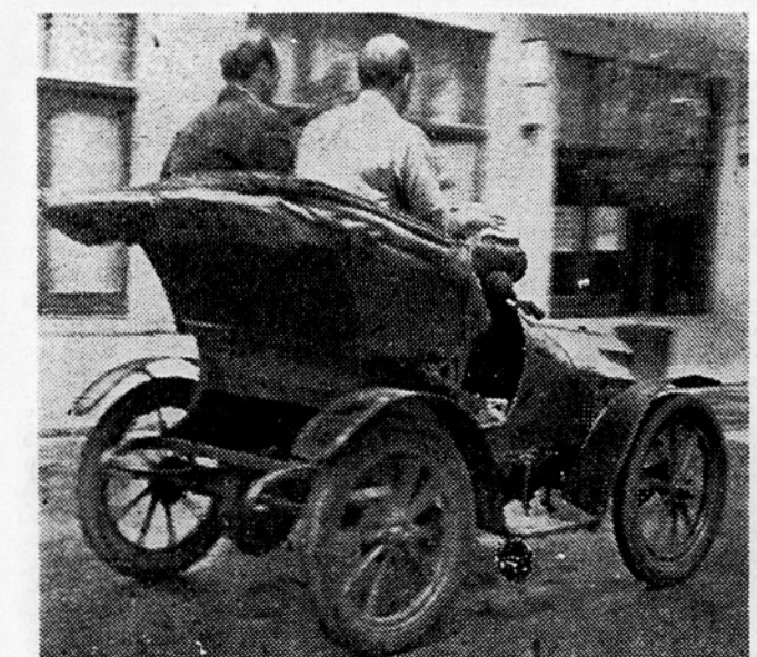
Z vso hitrostjo skozi Bled

Za epilogo pa še nekaj posebnosti: kolesar se je spretno zadrevil na svoje visoko vozilo, avtoveterana pa je moral množica potisniti, da je motor užgal, in vozilo je — ovito v oblak dima — z ropotom in burno pozdravljeno zapustilo Bled. Pa srečna jima pot!