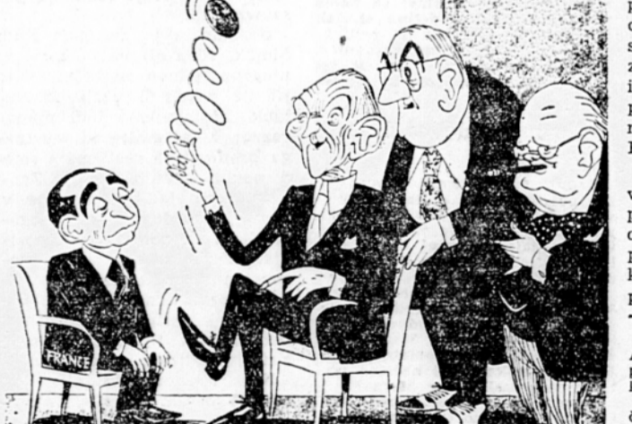
... Ce Francija ratičificira sporazum o EOS do 15. avgusta dobi Zahodna Nemčija takoj suverenost in armado, če pa je ne ratičificira, dobi Zahodna Nemčija takoj suverenost, armado pa nekoliko kasneje... A. Adenauer: »Ce bo glava, dobim jak, že bo številka, pa ti izgubiš!« (Karikatura; Vicky v listu »Daily Mirror«)