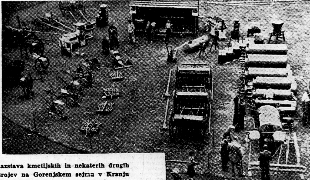
Razstava kmetijskih in nekaterih drugih strojev na Gorenjskem sejmu v Kranju

Turistična razstava prikazuje lepote Gorenjske in vabi obiskovalce, naj jih obiščejo. Razstava industrijske, obrtne, komunalne in živilske higijene pa predvsem opozarja, kako se obranimo boleznim. Močno je poudarjena borba proti obratnim nezagodam. Statistika kaže, da je bilo leta 1951 v okra-