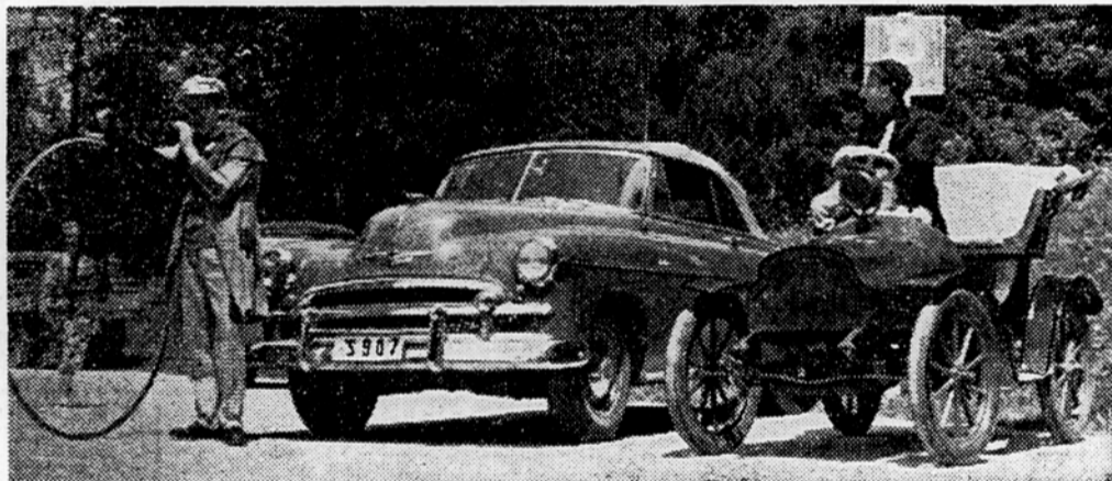
Čudna družina se je sestala včeraj na Bledu. Kolo iz leta 1880, odkrito kolo na Stajerskem. Chevrolet in Daimler Benz avto iz leta 1904, ki lahko razvije neverjetno hitrost 15 km na uro

V četrtek je Bled doživel nenavaden jubilej, in sicer 50-letnico prvega motornega vozila, ki je prišlo v Slovenijo. Iz Ljubljane sta