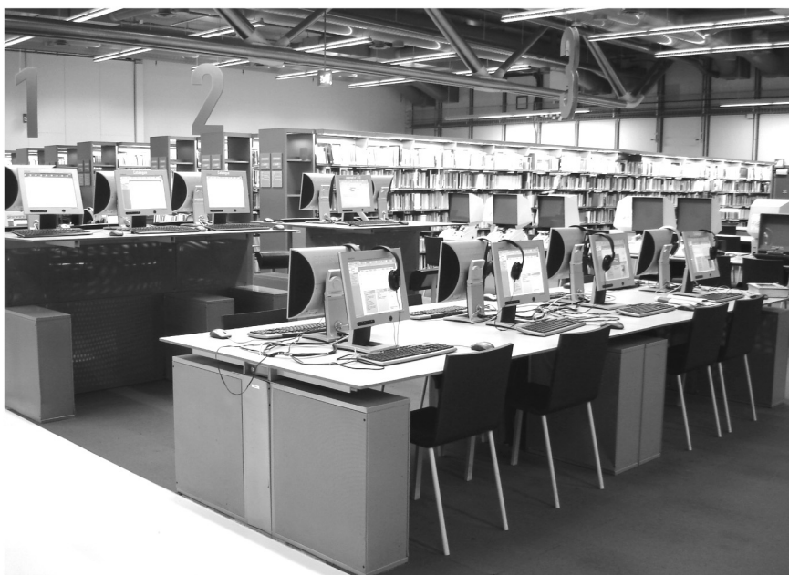
Slika 2: Bpi

Knjižnica je odprta vsak dan razen ob torkih od 12h do 22h oziroma ob sobotah, nedeljah in praznikih od 11h do 22h (tedensko 62 ur). Poleg torkov je v letu zaprta le še 1. maja.