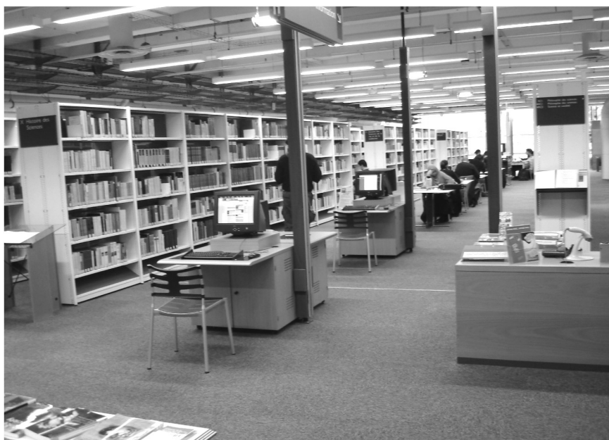
Slika 3: Mediateka Mesta znanosti in industrije, Knjižnica za zgodovino znanosti

Članstvo v knjižnici ( Cité-pass ) je lahko združeno z možnostjo celoletnega obiskovanja razstavnih prostorov na dveh nivojih nad knjižnico, v katerih so organizirane občasne in stalne razstave na temo znanosti in industrije (članarina za starejše od 25 let znaša 20 EUR za eno leto, z dodatno možnostjo obiska razstav 35 EUR). Knjižnica je ob ponedeljkih zaprta in odprta vsak torek od 12h do 19.45 ter od srede do nedelje od 12h do 18.45.