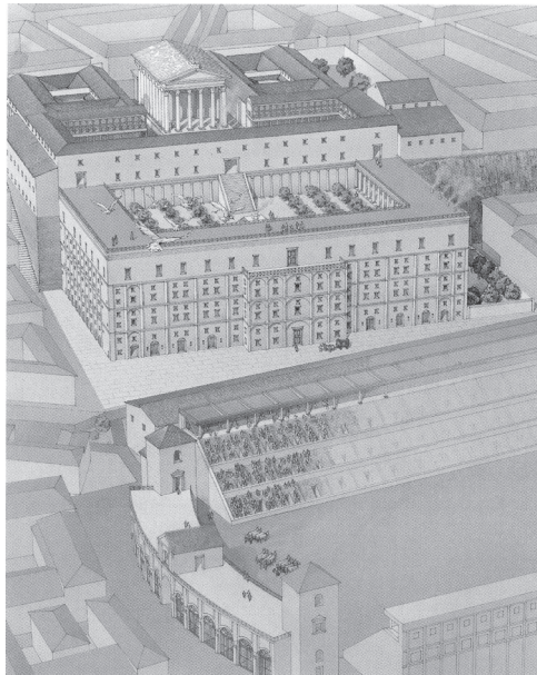
Slika 2: Rekonstrukcija Avgustove hiše (pred njo Circus Maximus ). Vir: Carandini, Bruno 2008, tav. II.