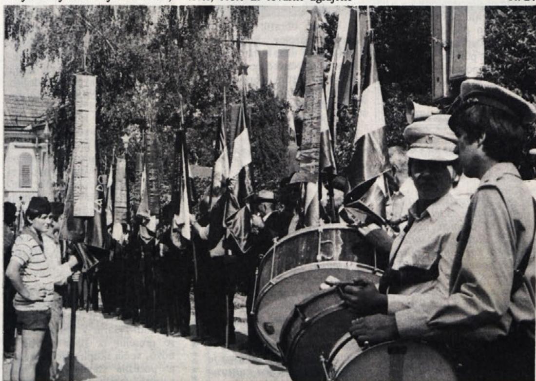
Z nedeljskega slavlja v Metliki