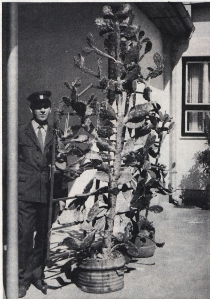
Gost si ustvari vtis o tovarni že ob pogledu na okolico. Pri vходу v metliški obrat je marsikdo veselo presenečen, ko zagleda velik kaktus, izredno lepo negovan. Na sliki vidimo da je vratar v primeri z njim za polovico nižji

Te dni je bila sprejeta nova kolekcija izdelkov za pomlad in poletje 1974. Dober mesec bodo v sejni sobi tovarne spet modne revije, na katerih bomo kolekcijo predstavljali poslovnim partnerjem. Pokazalo se je namreč, da so revije pri prodaji izdelkov zelo pomembne. Manekenke bodo domača dekleta, ki so se v tem poslu že kar izurile.