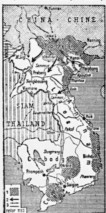
1. Področje v Vietnamu, ki so pod oblastjo Ho Si Minhových čet, 2. Pustice kažejo smer vdora Ho Si Minhových čet iz Vietnamu v Laos, 3. Železniška proga in cesta. Na trasi iz Laosa, Burmo in Kitajsko je bila na kitajskem državi ozemlju ustanovljena avtonomna republika Lahu.

Zaplet v Koreji se je razvijal neugodno tako za Kitajsko kot za Sovjetsko zvezo: skupni nastop