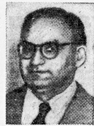
Mohamed Ali, predsednik pakistanske vlade

Kairo, 5. maja (Reuter). Vrhovni glavar židovskih verskih skupnosti v Egiptu, veliki rabin Haim Nahum, je pozval vse židove, ki živijo v Egiptu, naj se združijo in strnejo okrog vlade generala Nagiba, da bi bile uresničene nacionalne zahteve te države. Nahum je dejal, da je vlada generala Nagiba zavrgla sleherni versko in plemensko predstavljanje in da mora uživati najpopolnejšo podporo vseh v Egiptu živčih židov pri njenih poskusih, da bi postal Egipt samostojen. Podobni poslanci sta poslala vernikom pred dve-ma dneva muslimanski verski poglavar ir patriarh kopt-ske pravoslavne cerkve.