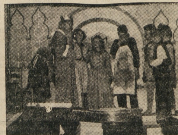
Z zaključne solske prireditve v Dolini

Med devetimi poklicnimi slovenskimi gledališči je v število tudi tržaško. Tudi to mora živeti in uspevati.