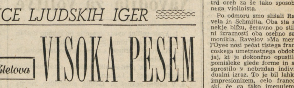
Med ilustriranimi mladinskimi knjigami, ki jih je lani izdala založba Mladinska knjiga v Ljubljani, je gotovo ena najlepših Tavčarjeva Visoka kronika, ki jo je ilustriral Boris Korb.

Med ilustriranimi mladinskimi knjigami, ki jih je lani izdala založba Mladinska knjiga v Ljubljani, je gotovo ena najlepših Tavčarjeva Visoka kronika, ki jo je ilustriral Boris Korb. Pravzaprav gre tu bolj za nekakšno opombo oziroma komentarje, ki poleg pisane besedila kakor ilokvne marginalije spremljajo potek pripovedovanja. Soto predvsem lapidarno, docela preprosto izvršene poobe predmetov, o katerih besedilo pripoveduje. — Poleg naslovne strani vidimo tu še figurarno kompozicijo, ki predstavlja tovarjenje vina iz Vipave na Gorenjsko in druge daljne kraje.