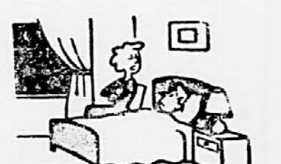
Kar potni ljubček. Ko se bo neka vrnil, bo nama OBEMA povedal lepo pravilico.

Ugotovljeno je, da duševni delavci najgloblje spijo v tujini in tudi dlje kot ročni delavci. Njihov globoki spanec traja šest ur. Če po teh urah ne vstanejo, padejo v poznih jutranjih urah v ponoven težak spanec, ki bolj utruja, kakor osvežuje.