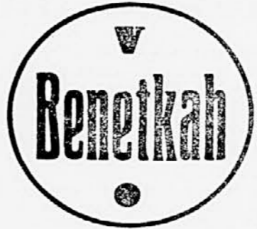
Fotografski aparat v dvorani, mu ga bodo zaplenili. Tiberti pravi, da je v Benetkah dovolj lepih motivov za navdušene fotoreporterje...

Pač pa bodo ZDA vzele iz »naftalinske 39 tankerjev iz druge svetovne vojne. Evropske države, članice organizacije za evropsko gospodarsko sodelovanje (OEEC), bodo same odločile, koliko nafte bo vsaka dobila. Prvenstvo pri porabi nafte ima industrija. Račun za napad na Egipt je v potem takem precej visok in prizadet; bodo morali seči globoko v žep.