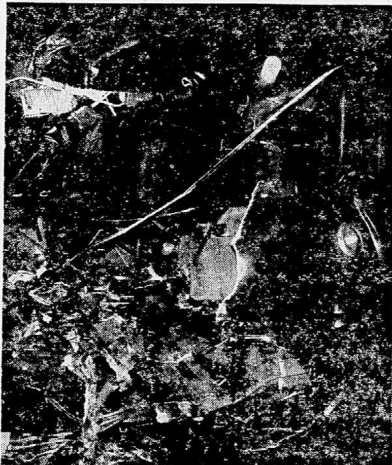
Na podeželski postaji Quille pri Bielefeldu v Nemčiji se je sletel motorni vlak v zadnje vagonce tovornega vlaka. Pri nesreči je bilo 22 ranjenih.

V Toskani v bližini Borgo San Lorenzo je imel neki delavec, psa Fida, ki ga je vsak večer čakal pred avtobusnim postajališčem, ko se je vračal domov. Med bombardiranjem leta 1943 pa je bil tudi gospodar ubit. Od tedaj je minilo že več kot trinaest let in pes Fido hodi še zmerom čakati gospodarja. Ko potniki izstopajo, veselo maha z repom v pričakovanju gospodarja in ko izstopi poslednji, se zalostno vrne domov. Ta zvestoba je ljudje tako ganila, da ga hranijo na občinske stroške in so sklenili, da mu bodo poleg tega postavili po smrti spomenik.