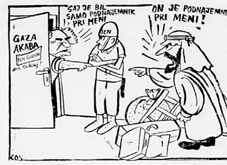
ZASEDANJE GENERALNE SKUPŠČINE OZNI