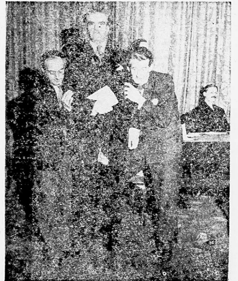
Vladna kriza v Veliki Britaniji povzročila vladno krizo tudi v muzeju voščenih lutk Madame Tussauds. V ozadiju je videti voščen lutko, ki predstavlja Macmillana, na sedežu ministrskega predsednika, medtem ko »Edena« nesejo drugam