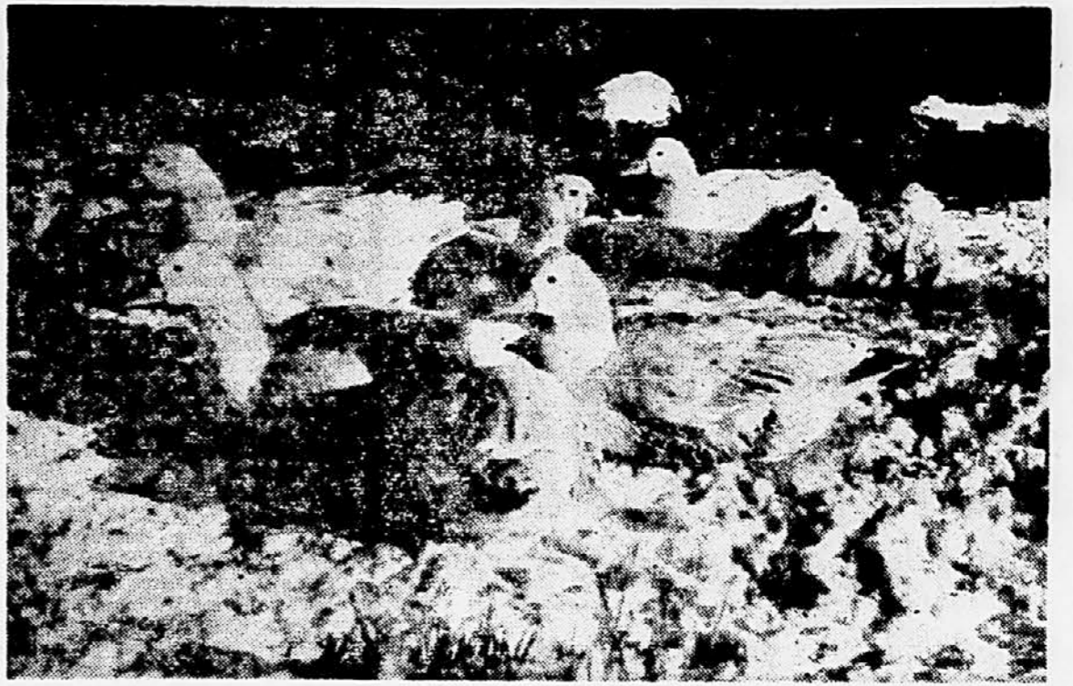
Zimska idila ob potoku

povečanje kmetijske proizvodnje. Prispeval bo lahko k boljši organizaciji tržišča s kmetijskimi pridelki, ker bodo kmetijske zadruge že vnaprej zanesljivo računale na določene količine kmetijskih pridelkov, ki jih bodo odkupile. V ta namen bodo že pred nastopom glavne pridelovalne sezone morale vzpostaviti potrebne poslovne stike s tržiščem. Ukrep bo nadalje verjetno vplival na stabilizacijo cen kmetijskih pridelkov, ker bodo kmetovalci vezani na časovno dogovorjeno prodajo svojih pridelkov. Ukrep pa bo seveda tudi v največjo korist samih pridelovalcev, ker bodo od večjih donosov prejeli večji izkupiček, poleg tega pa si bodo že vnaprej zagotovili trg za svoje pridelke. A. J.