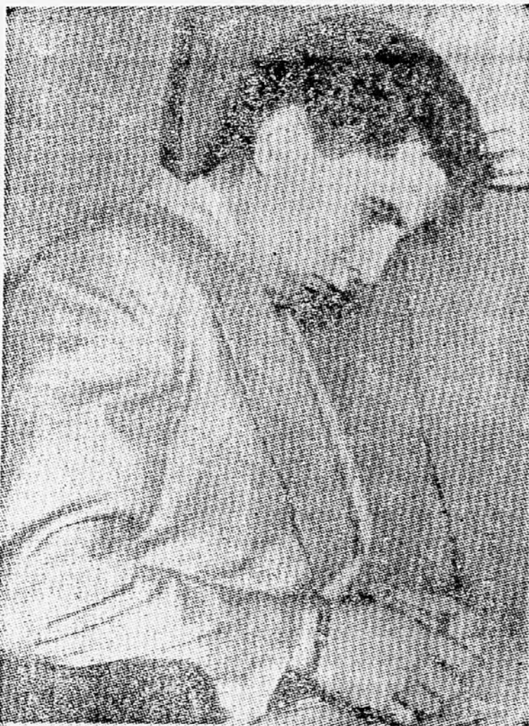
Ena izmed zadnjih slik trindvajsetletnega morilca Johna Grahama

Zločinca Grahama, ki je razstrelil letalo s 44 potniki, da bi dobil zavarovalnino po materi, je doletela pravična kazen