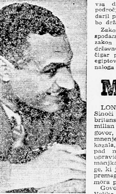
kapitalistične težnje v Egiptu. Te težnje so se nenavadno naglo razvijale v zadnjih šestih mesecih, zlasti pa se po nacionalizaciji Suške družbe.

Egiptovska vlada je 15. januarja, kakor smo poročali včeraj, izdala štiri zakone, ki določajo več pomembnih gospodarskih ukrepov, zlasti glede vloge države v gospodarstvu. Zakon predpisuje ustanovitev posebne ekonomskega organa, ki bo predvsem povezal udeležbo države v sedanjih podjetjih ali javnih gospodarskih ustanovah. Ta organ bo pravzaprav zastopnik države v vseh gospodarskih zadevah in njegova ustanovitvena dokazuje naraščajoče državne