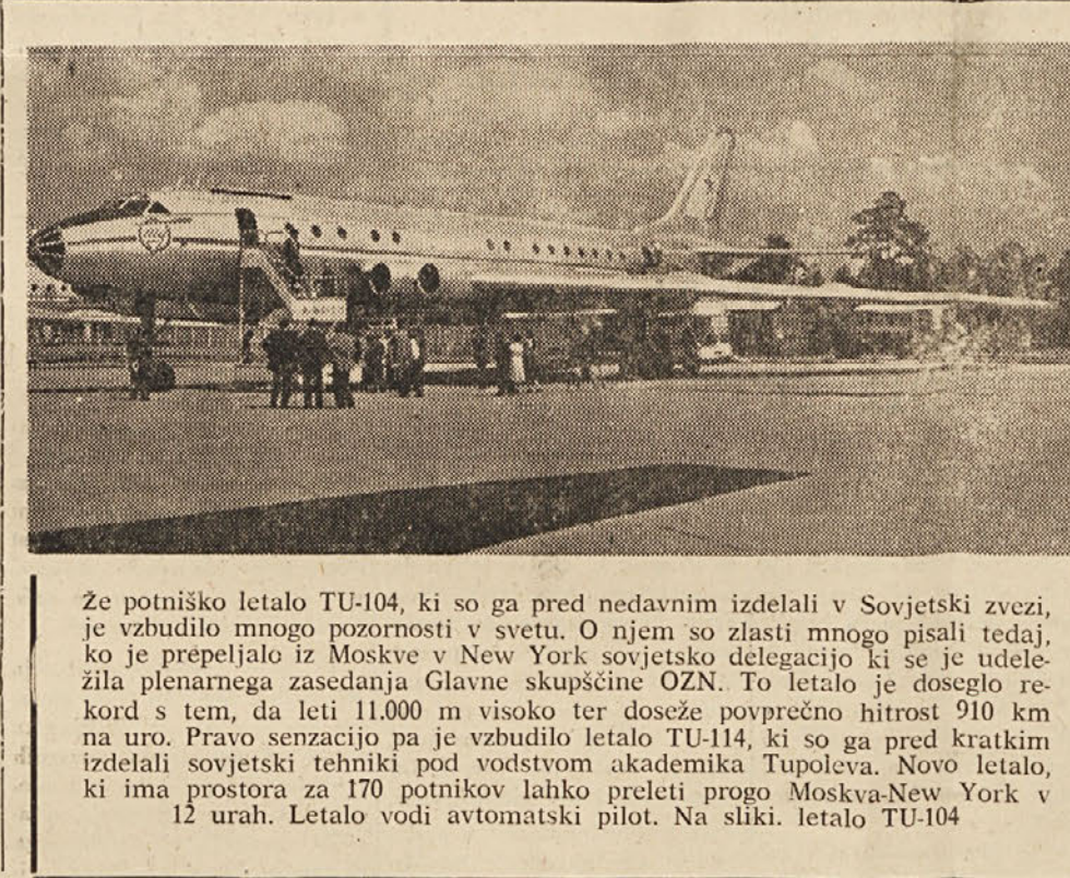
Ze potniško letalo TU-104, ki so ga pred nedavnim izdelali v Sovjetski zvezi...