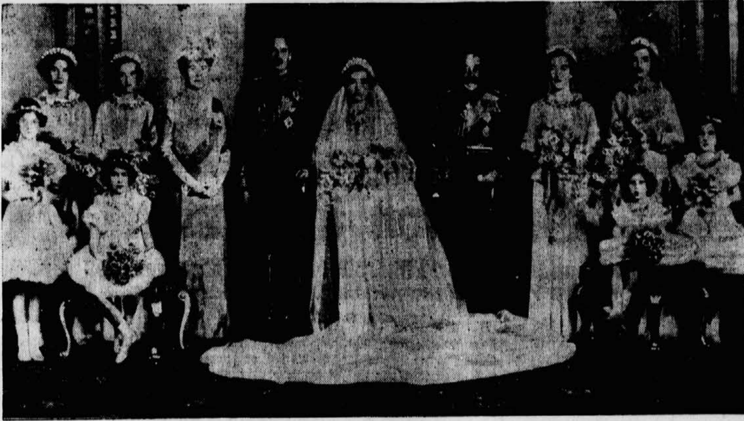
In der Privatkapelle des Buckingham-Palastes zu London wurde am Mittwoch der Herzog von Gloucester, der dritte Sohn des Königs von England, mit der Herzogin Lady Alice Scott getraut. Dieses Bild zeigt das Brautpaar mit dem König und der Königin von England nach der Trauung; ganz links Prinzessin Elisabeth und ganz rechts Prinzessin Margaret, die Töchter des Herzogs von York, die die Braut zur Trauung führten.