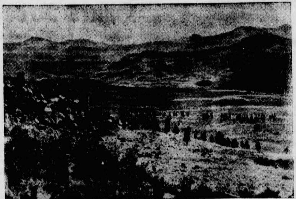
Ein seltenes Bild von den Kämpfen in Abessinien. Ganz im Hintergrund flieht man Abessinier (an ihrer weißen Kleidung deutlich zu erkennen), die von den nachdrängenden italienischen Eingeborenentruppen verfolgt werden.

hält auch einen Militärvertrag. Abessinien hofft, daß sich Ibn Saud, der König von Hedschas, diesem Bündnis anschließen werde. Saïdi Mohammed, der Vertreter Ibn Sauds, weilte einige Tage in Adis Abeba, wo er Besprechungen mit Haile Selassie hatte.