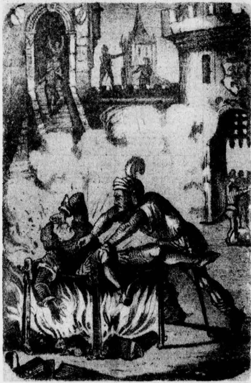
... mit der Kraft des Wahnsinns schleuderte er seinen leiblichen Bruder in die brodelnde Flut

Nachdem die Jungfrau sich wieder aufgerafft, trat sie in ein Kloster ein. Der unselige Bruder-mörder aber suchte durch ein bußfertiges und beschauliches Leben in menschenferner Einsamkeit den Geist seines Bruders zu versöhnen.