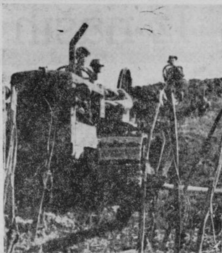
Kmetijsko gospodarstvo Dravinjski vrh rigola s traktorji. Najprej bodo zrigovali 6 ha površin za vinarstvo, nato pa še 10 ha za sadovnjak. Z mehničnim rigolanjem b'vlega vinograda nad Vidmom (prej Klenošek) je ovržena trditev, da tukaj mehanična obdelava zemlje ni mogoča.