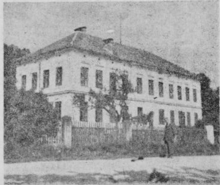
Osnovna šola in nižja gimnazija v Majšperku

še vedno izbirne šole odpadde in da jih bodo nadomestile splošne osemletne šole, na katerih bo grajen ves ostali šolski sistem. Razumljivo je da bo tudi v bodoče kvaliteta naših šol odvisna tako kot že doslej, predvsem od kvalitetnega podajanja učne snovi in od splošnih materialnih prilik naših šol. Materialne prilike pa se bodo nedvomno v bodoče izboljšale, prav tako kot bo nedvomno rasla tudi iz leta v leto kvaliteta dela naših šolnikov. Eno in drugo pa nam torej zagotavlja kvaliteten rast naših šol.