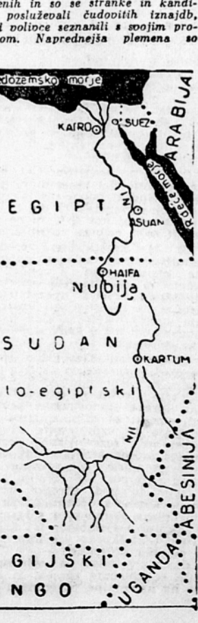
Sudan ima svoj parlament in svojo vlado, prvo narodno vlado z zgodovine, deloma je naredila odločen korak na poti k neodvisnosti. Jasno je, da je britanska oblast v Sudanu sedaj naglo bliža svojemu koncu. Za sedaj ni najpomembnejše, kako stališče bo zaozel od Súdana Egipt, če zamenja položaj Britanije o deželi, kajti sudsanski narod bo odločil o usodi svoje države.

Egipt je v začetku zahteval samo delež pri upravi, ki bi mu po sporazumu pripadala, pozneje je zahteval tudi deželo samo. Britanci so poskušali na vse mogoče načine dokazati, da Sudan ne želi imeti ničesar skupnega z Egiptom, vendar pa je ena iz dveh stran koncu. Lo prišlo na to, da bosta dali deželi samoupravo in prepustili narodu Súdana, da odloči sam, če hoče biti svobodna ali pa priključen Egiptu. Po dolgih pogajanjih je bil približno tak sporazum dosežen februarja 1953,