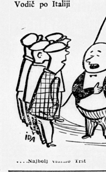
Najbolji vladavina Trst

je govorila na sestanku indijske federacije združenja za OZN, je ga Lakshmi Pandit dejala, da so politiko Indije na mednarodnem področju dovoljno sprejeli celo v deželah, kjer so do nedavna kritizirali. Ga Pandit je poudarila, da je neobhodno potrebno, da narodi v celoti sprejmejo načela Ustavne listine OZN.