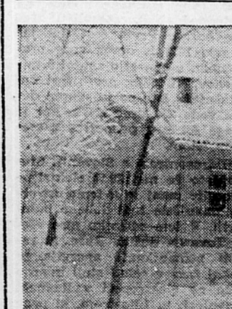
Včeraj so odprli na Fužinah pri Ljubljani nov ambulatorij za duševno higieno

»Mestno gledališču v Ljubljani so zaradi pomanjkanja kuriva do nadaljnjega odpovedane vse predstave.