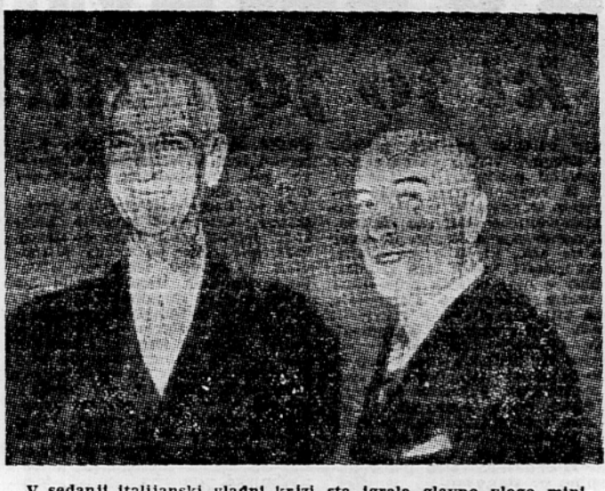
V sedanjih italijanskih vladi sta igrala glavno vlogo minister za kmetijstvo Salomone (levo), katerega je hotel Pella prvotno nameravati rekonstruirati vlado zamenjati z bolj desno usmerjenim Aldisimo, in notranji minister Fantani, voditelj leve struje »demokratske iniciative« v krščansko-demokratski stranki, ki je najodločneje nasprotoval zamenjavi Salomoneja. Fantanija, katerega podpira tudi katoliška akcija, je krščansko-demokratska stranka določila kot svojega kandidata za sestavo nove vlade.