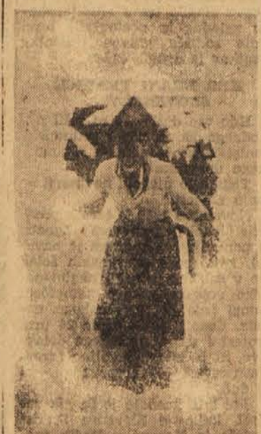
V nekaterih krajih v Srbiji je sneg tako debel, da so ponekod na ulicah izkopali rove v njem

Zastopnik hrvatske trgovinske zbornice je predlagal, naj bi osnovali koordinacijski odbor vseh republiških trgovinskih zbornic v državi. Ta odbor bi prejel stalne konference o problemih, s čimer bi republiške zbornice dosegle enotnost v delu. Ta predlog so vsi delegati navdušeno pozdravili. Hkrati se je odbor izrekel proti nameravani ustanovitvi zunanjetrgovinske komore (s tem stališčem obnega zbor se je solidariziral tudi zastopnik hrvatske trgovinske zbornice), češ da bi s tem, ko bi zunanjo trgovino nekako odvojili iz splošne gospodarske problematike, s katero se ukvarjajo trgovinske zbornice, prišli olje na ogenj raznim birokratskim težnjam v zunanji trgovini. M. Z.