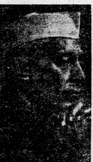
Fam Van Dong

Skupno sporočilo izraža upanje, da bo azijsko-afriška konferenca z izmenjavo miselnosti na tem sestanku podprla mir, sodelovanje in napredek na vsem svetu. S tem sporočilom je Severni Vietnam tudi formalno potrdil svojo podporo načelom koeksistence in poudaril potrebo po dosegi enotnosti Vietnama s