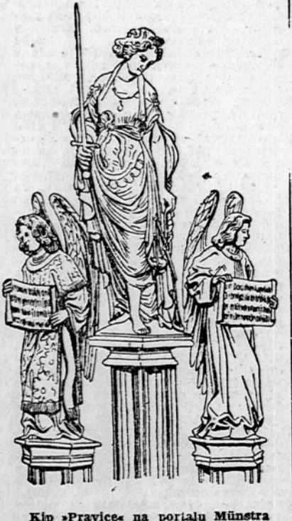
Kip »Pravice« na portalu Münstra

Novo rusko prvenstvo. Nedeljski sovjetski listi prinašajo članke o prvem ruskem zračnem balonu za katerega trdijo, da so ga spustili 1731 leta, 52 let pred balonom bratov Montgolfier. »Krasniy Flot« piše v tej zvezi, da bi bilo treba izum balona pripisati Rusom že od XI. stoletja dalje, ker je takrat kijeviski knez Oleg med obleganjem mesta ukazal napraviti balon, da bi vzpostavil zvezo z zaledjem.