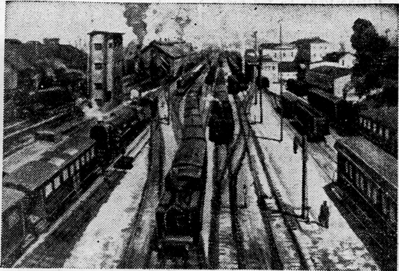
Pomniški promet v Ljubljani vsako leto narašča in niso redki dnevi, ko se mora do 40.000 potnikov gnesti na ozkem in tesnem prostoru ljubljanske železniške postaje (glej članek na 3. strani)