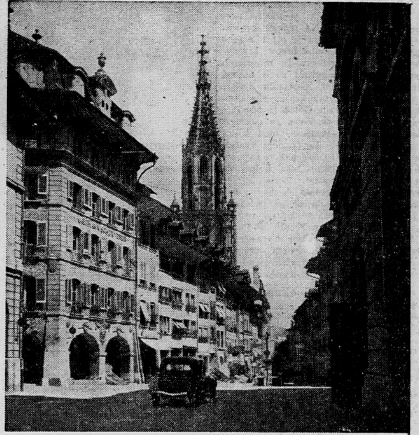
Ozka bernska ulica, v ozadju stolp katedrale

oficirji opravljajo svoje civilne posle, dvakrat na leto pa grejo na orožne vaje po 2 meseca. Vsak vojni obveznik, oficir ali vojak, mora vsako leto loseči določeno število zadetkov pri strelskih vajah. Zato ima vsak svoje strelišče, kjer vadijo vsako nedeljo. Kdor ne bi dosegel predpisane števila zadetkov, mora ob koncu leta za par dni v vojsko izven predpisanih