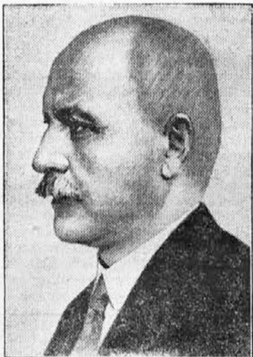
Bolgarski minister za notranje zadeve Mušcanov je prevzel sestavo nove vlade v Bolgariji.