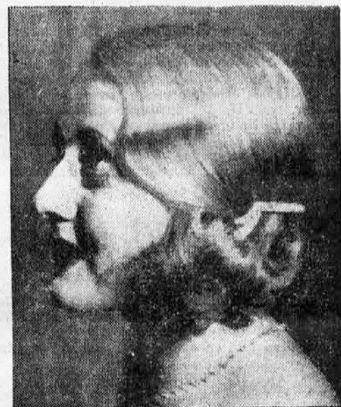
Nova barva las.

V Parizu so ustanovili poseben gasilski oddelek na motorjih. Oddelek ima motorno brizgalno s 120 metrov cevi, motor pa je močan 5 konjskih sil. Na vozu je prostora še za 2 gasilca.