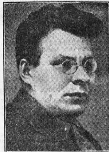
Nov mogočnej v Rusiji

bila. Neki bankir je ponudil 11.000 funtov, stari vojvoda Alban pa 17.000. Vsi so čakali napeto, kaj bo. Vojvoda pa je dvignil svojega devetletnega sinčka in je dal tega poljubiti od igralke; tako je rešil svojo čast in igralkin ponos.