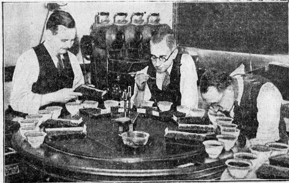
Ljudje, ki morajo piti kavo.