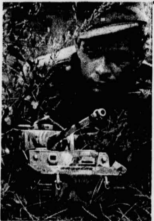
PK-Kriegsbericht Weber (Sch) Hier der kleinste »Tiger«

gen, Schnitzmessern usw. beginnen, ganz abgesehen davon, daß dieses und jenes auch finanziert werden muß. Doch die Jugend der Untersteiermark wird auch hier Mittel und Wege finden, ihren Plan,