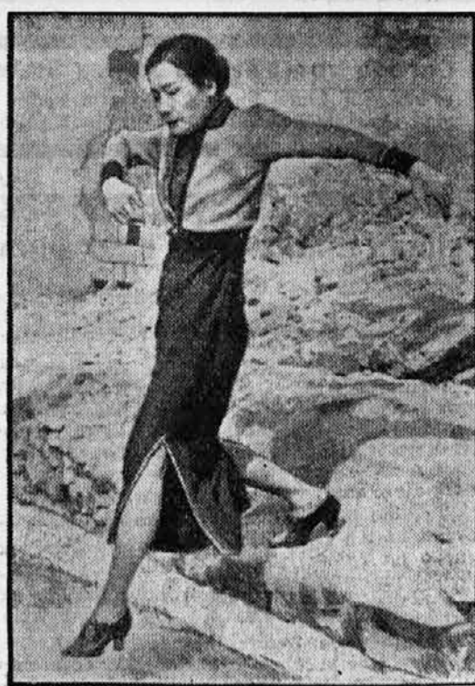
Zena kitajskega voditelja maršala Cangkajšeka ogleduje lijak, ki so jih naredile japonske bombe.

Do tega naravnost fantastičnega programa nove mornarice, ki nima primera v zgodovini in prekaša tudi angleške načrte (Angleži gra-