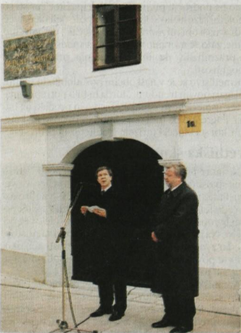
Minister za obrambo dr. Anton Grizold je v slavnostnem nagovoru pred rojstno hišo Rudolfa Maistra (zgoraj levo spominska plošča) izpostavil zgodovinski spomin na generala Maistra kot spomin na izjemnega Slovenca in vse tiste domoljube, ki so v prelomnih trenutkih začutili, da je treba za svoj narod nekaj storiti.