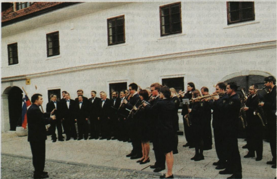
Pred Maistrovo rojstno hišo so zadoneli zvoki Mestne godbe Kamnik in glasovi pevcev Prvega slovenskega pevskega društva Lira - prav tako kot pred 66. leti, ko je bila na hiši odkrita spominska plošča generalu Maistru.

stro-ogrške vojske. »Upravičeno ga imenujemo borca za severno mejo, tako na štajerskem kot koroškem delu, saj je novembra 1918 dosegel uspehe z odločnimi in izredno hrabrimi akcijami, v katerih so prišle do izraza lastnosti dobrega poveljnika. Uspeh je lahko dosegel tudi zato, ker je užival ugled in zaupanje podrejenih in ker je znal svoje vojake motivirati glede na okoliščine. Z leti vračamo večje spoštovanje generalu Maistru in čast tistim, ki poznajo osvoboditelja Maribora in Štajerske ter so nanj in na njegove borce ponosni. Zgodovinski spomin na Maistra je spomin na izjemnega Slovenca in vse tiste domoljube, ki so v prelomnih trenutkih začutili, da je treba nekaj storiti za svoj narod,« je poudaril minister Grizold.