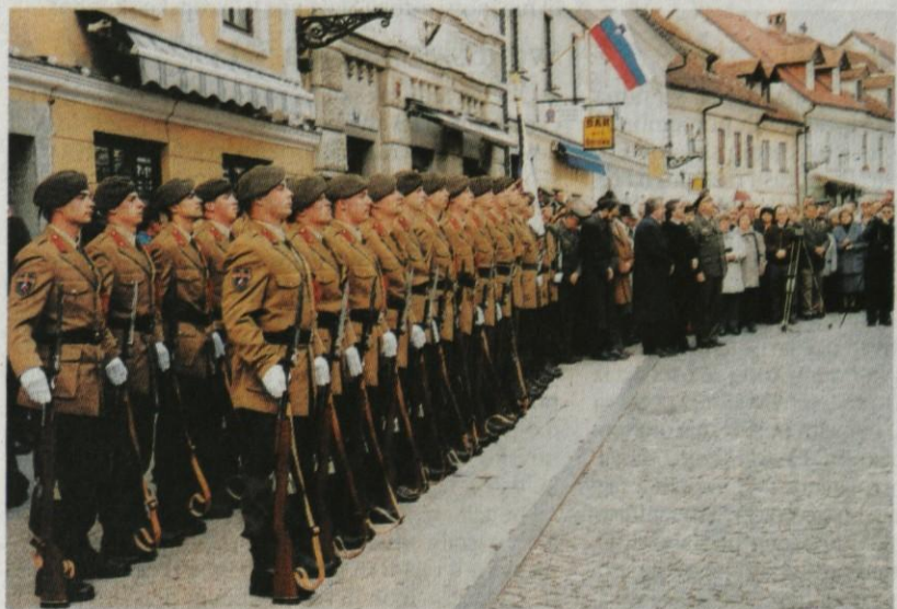
Na slovesnosti pred obnovljeno Maistrovo rojstno hišo na Šutni je sodelovala Častna enota Slovenske vojske.