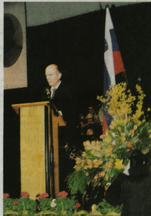
Slavnostni govornik predsednik republike dr. Janez Drnovšek je na osrednji državni slovesnosti v počastitev Maistrovega spomina v Domu kulture Kamnik poudaril pomembnost vojaških podvigo generala Maistra in njegove osebnosti za takratni in sedanji čas. Orisal je zgodovinsko pot našega naroda od časov, ko se je general Maister s svojimi vojaki bojeval za našo severno mejo, do časa, ko vstopamo v prostor brez meja, v Evropsko unijo.