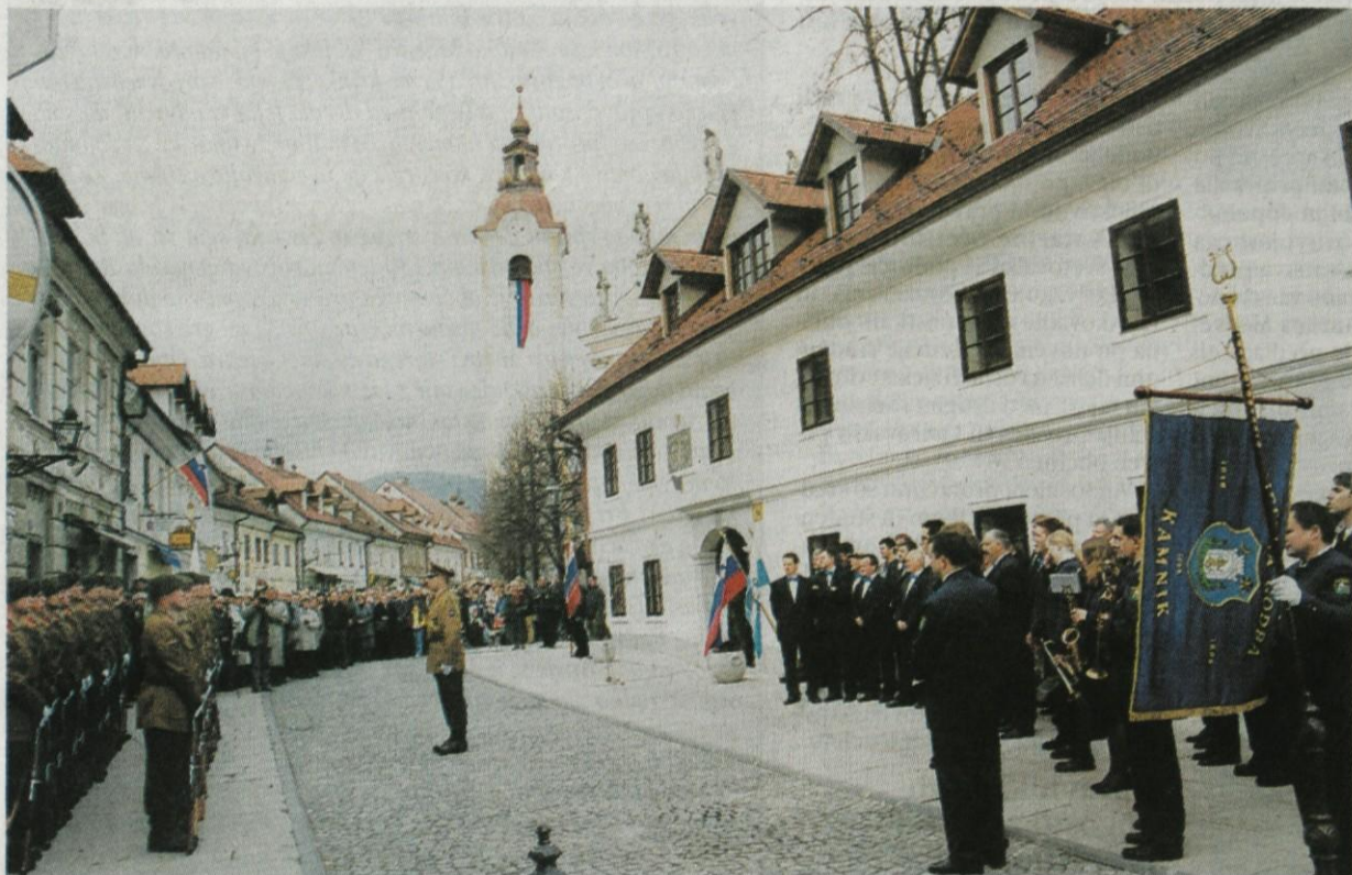
Slovesnost pred prenovljeno Maistrovo rojstno hišo na Šutni so ob Častni enoti Slovenske vojske spremljali zvoki Mestne godbe Kamnik in ubrano petje Prvega slovenskega pevskega društva Lira, prav tako kot pred 66. leti, ko je bila na tej hiši odkrita spominska plošča generalu Maistru.

Minula sobota je bila praznična in slovesna, saj se je Kamnik z odprtjem obnovljene zunanosti Maistrove rojstne hiše in osrednjo državno slovesnostjo v Domu kulture še enkrat poklonil spomenu na velikega Kamničana, generala, rodoljuba in pesnika Rudolfa Maistra Vojanova.