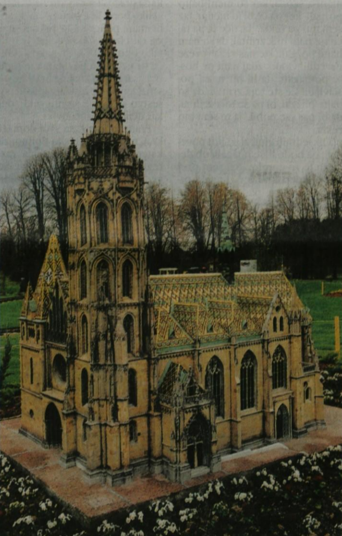
Znamenita in vsem obiskovalcem Budimpešte dobro poznana Matjaževa cerkev stoji za ribiško utrdbo. V cerkvi so potekala kronanja številnih madžarskih kraljev.

in zloženska z naslovom Ptice v Arboretumu Volčji Potok.