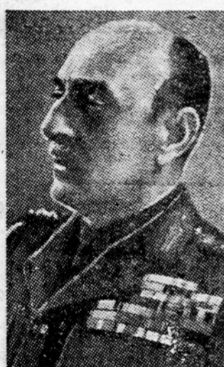
G. Papagos, predsednik grške vlade

Na poti iz Djevdjelije do Skoplja je g. Papagos jugoslovanskim novinarjem odgovoril še na nekaj vprašanj, ki se tičejo razvoja naših dveh dežel.