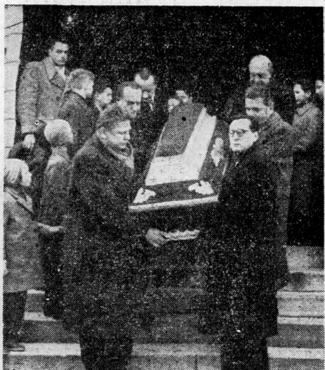
Slovo od Marije Vere. Predstavniki slovenskega gledališča nosijo krsto pokojne umetnice Marije Vere iz avle Dramatice na aviofurgon, ki jo je popeljal na Zale.

Nato so dvignili krsto z zemeljskimi ostanki Marije Vere. Tako se je končalo. Končana je bila dolga pot umetnice od Gorice na Dunaj, kjer je vzmetela v dramski šoli, slavila svoje prve umetniške uspehe in se z njimi odpeljala v švicarski Zürich na prvo poklicno delo. Končana je bila pot po raznih nemških gledališčih, ki so jo pripeljala nazadnje v središče srednjeevropskega gledališkega umetniškega življenja — k Reinhardt. In mi smo se spomnili njene slave, ki jo je uživala po najpomembnejših srednjeevropskih mestih in na gostovanjih po Rusiji. To so bili viski srednjeevropskega igralskega sveta. To je bil za Marijo Vero veliki oder. Odločila pa se je za mali oder, za svojo domovino. S tem je storila pomembno dejanje, ki ga bo najbrže šele slovenska gledališka zgodovina nekoč do kraja pravilno ocenila. — V zavesti slovenskih ljudi pa živi po njeni zaslugi stotine in stotine človeških likov iz klasičnih tragedij, Shakespeara, skandinavske, nemške in tudi francoske dramatik. Velikanska