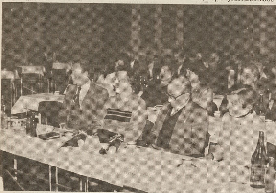
avnostna seja delavskega sveta delovne organizacije Blagovni center

Tozdi Transport in obrtne storitve, ki opravlja kot osnovno de-