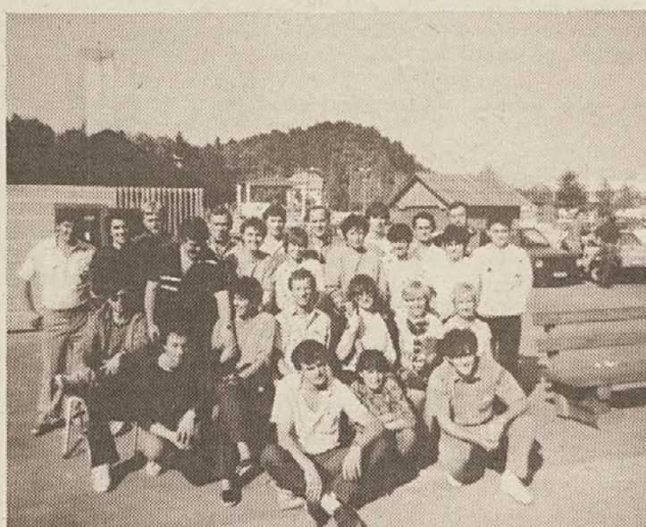
Športniki Blagovnega centra

rekreacijo, za kulturo, za informiranje ter za moralno stimuliranje.«