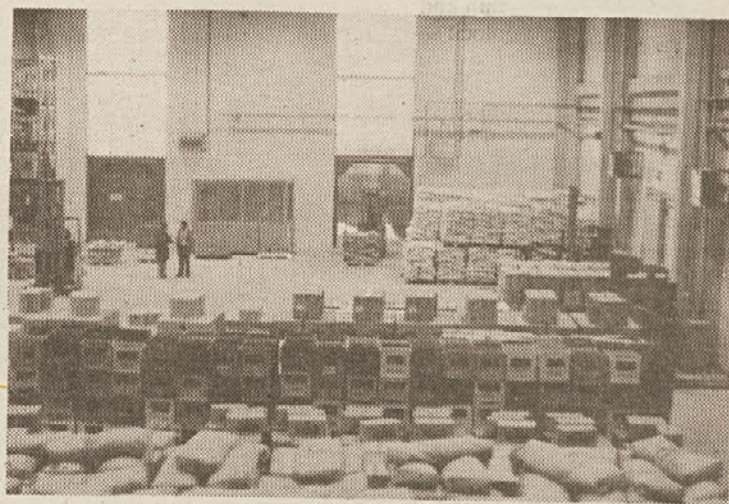
Blok skladišče v RPPC tozda Preskrba

TDO Blagovni center zaposluje 686 delavcev, kar pomeni, da se število zaposlenih ni bistveno povečalo v primerjavi z letom 1981, ko je bilo zaposlenih 660 delavcev.