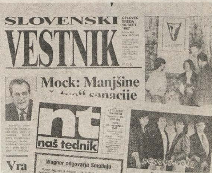
Letopis slovenskog življenja: listovi naših sunarodnika u Austriji