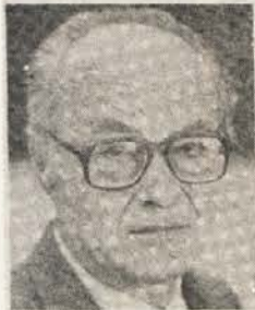
Piše SLAVKO FRAS

Naši sunarodniki u Koruški nemaju dnevni list, niti vlastitu televizijsku emisiju, pa su im nedeljni listovi glavna poluga informisanja, što se ogleda u nacionalnoj svesti mlade slovenačke inteligencije u susednoj Austriji.