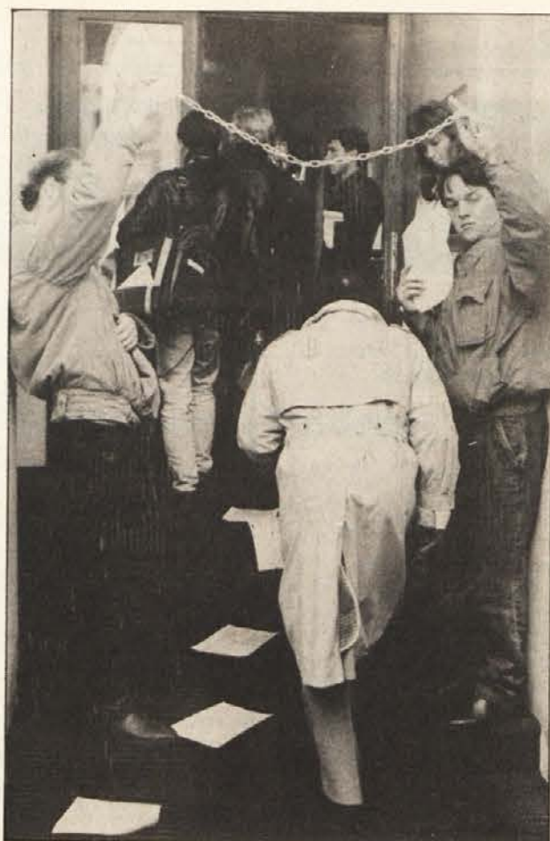
Po akcijah na Dunaju in v Gradcu so demonstranti pretekli teden zasedli poslopje deželne vlade v Celovcu. Policijska akcija (slika levo) je ukinila miren protest.