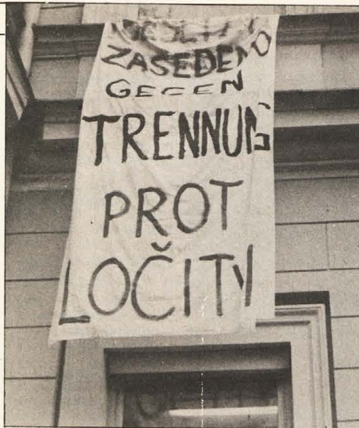
„Zasedeno – besetzt, gegen Trennung – proti ločitvi“. Mit diesem zweisprachig gehaltenen Transparent machten die „Besetzer“ der Landesregierung die Passanten auf die kritische Situation der slowenischen Volksgruppe nach dem Drei-Parteien-Pakt aufmerksam.

Im Rahmen der Budget-Debatte im österreichischen Parlament in Wien erklärte SPÖ-Klubobmann NRAbg. Heinz Fischer, „daß es ein Ruhmesblatt für das Parlament wäre, wenn die in der Kärntner Schulfrage anhängigen Fragen in einer Weise gelöst werden können, die auch die slowenische Minderheit einbeziehen; – daß also die 3-Parteien-Vereinbarung zu einer 4-Parteien-Vereinbarung erweitert würde“. Fischer hatte schon kurze Zeit nach dem Drei-Parteien-Pakt über die Trennung der Schüler in den zweisprachigen Volksschulen Südkärntens als erster SPÖ-Politiker Kritik am Wiener Beschluß geübt.