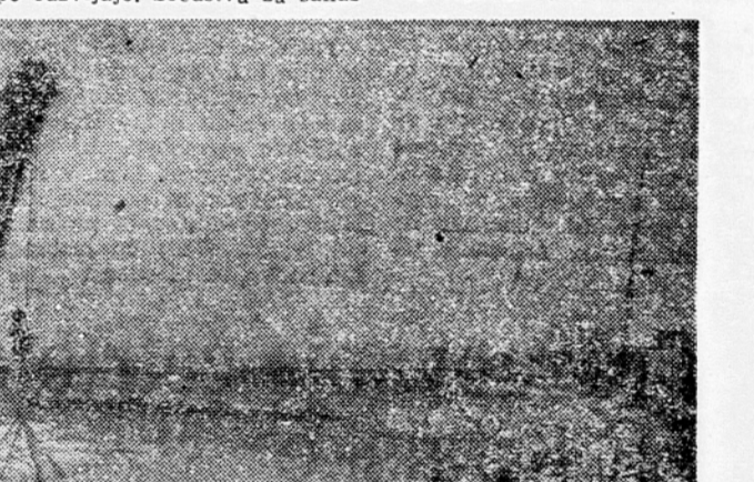
Pristanišče v Sisku

Letos bodo izdelali načrt za gradnjo novega pristanišča v Sisku. Prihodnje leto bodo že pričeli z deli, ki bodo trajala nekaj let. Najprej bodo postavili dva velika žerjava z zmogljivostjo 200 ton. En žerjav bo natovarjal in iztovarjal železo in železno rudo za potrebe železarne. V Sisku je zdaj tudi naša največja plovna delavnica za popravilo rečnih ladij. To je tudi eden izmed razlogov, zaradi katerih bodo sedež rečne plovbe Hrvatske prenesli v Sisk.