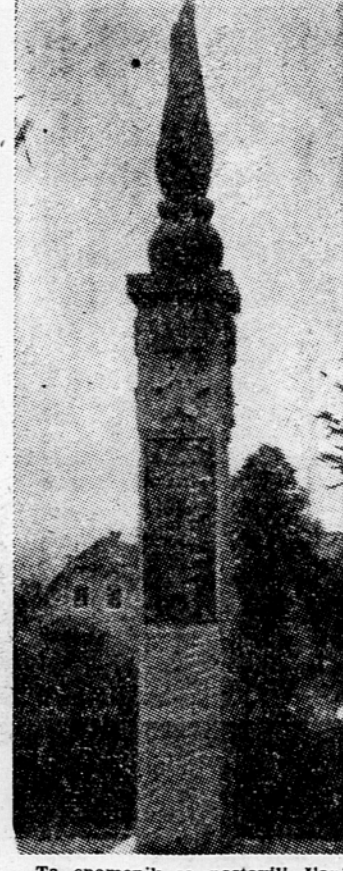
Ta spomenik so postavili člani Zveze borcev iz Šoštanja v spomin prvega partizanskega napada na mesto — 8. okt. 1941. — Spomenik je bil odkrit 8. okt. 1952.

Z zborovanja so zbrani poslali pozdravno pismo izvršnemu svetu Zveze borcev Slovenije. Po končanem proslavi na Trgu svobode so ljudski odborniki Šoštanja položili več vencev k spomenjku, kjer je bilo dan po napadu na mesto ustreljenih 10 talcev.