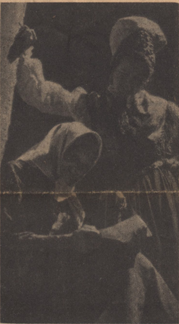
SLOVENSKA MATI ČITA PISMO

Rešitev slovenstva ni v reševanju starih razvalin, niti ne v obupnem prizadevanju, da ohranimo stare „priznane voditelje“, niti ne v kontinuiteti udomačenih strank, še manj v kakšni kontinuiteti takozvane Jugoslavije in „narodne monar-