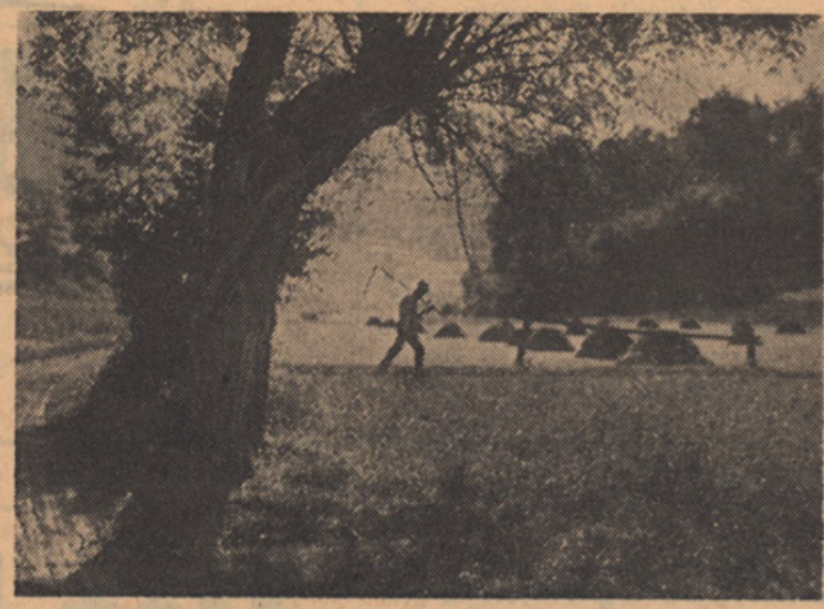
V JUTRANJI ROSI

Salzburger Nachrichten, ki Slovenecem ni naklonjen list, prinaša v številki 91 (20. aprila 1955) na naslovni strani članek iz Celovca z naslovom „Tajni pakt s krvnikom“ (podpisan Claus Gatterer). Članek poroča, da so prišli preko še zasneženih Karavank prvi begunci na Koroško. Zaradi italijanskega vračanja beguncev pričakujejo, da se bo pri tok v Avstrijo toliko bolj povečal. Pravilno povdarja, da so narodi in državniiki na Zapedu pozabili na trpljenje narodov pod komunizmom. Sto od pet tisoč beguncev so zvezane poslali nazaj v državo, ki jih je tako mučila, da jim ni mogla več biti domovina; pod grožnjo uporabe orožja so jih vlekli nazaj v domovino; padli so pod streli italijanskih in jugoslovanskih pušk, ki so se združile pri tem krutem krvavem poslu, ker so dvakrat izdani - poskušali zbežati še med „uradno predajo“. Piseč pravilno povdarja, da v totalitarnih državah ni mogoče ločiti med političnimi in gospodarskimi begunci. Članek zaključuje: „Za te begunce smeta veljati samo dve misli: 1) Naša človečanska in demokratična dolžnost je, da jim nudimo zatočišče. 2.) Nemogoče je izvesti razlikovanje po motivih, ker v ljudskih demokracijah te razlike ni. Mnogo manj nevarno je dejstvo, da se med sto pravičnimi vtihotapita dva zločinca ali vohuna, kakor pa pakt s krvnikom, po katerem se naše demokratične pravne države postavljajo na pravno ravan ljudskih demokracij.“