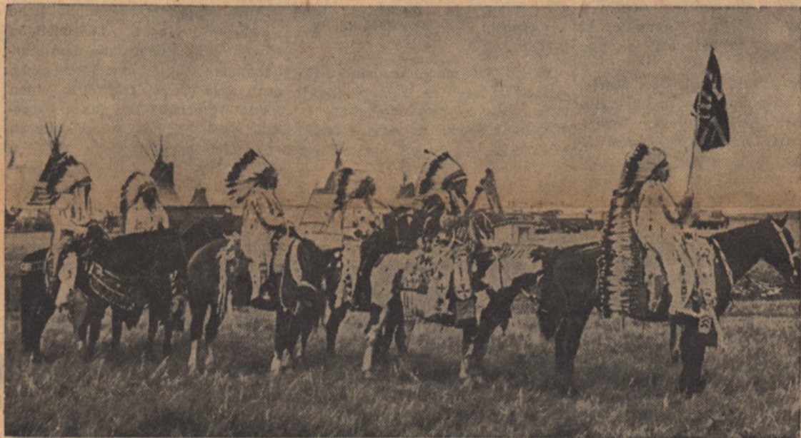
INDIJANCI IZ ALBERTE - KANADA (levo)