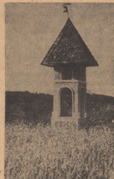
ZNAMENJE OB POTI . . .

Zato sme človeštvo kot celota, pa tudi posamezni narodi upati na boljše bodočnost le, kadar bo človeštvo zopet zedinjeno ne samo v strahu pred uničenjem, marveč v priznavanju istega naravnega prava, ki veže enako velike kot