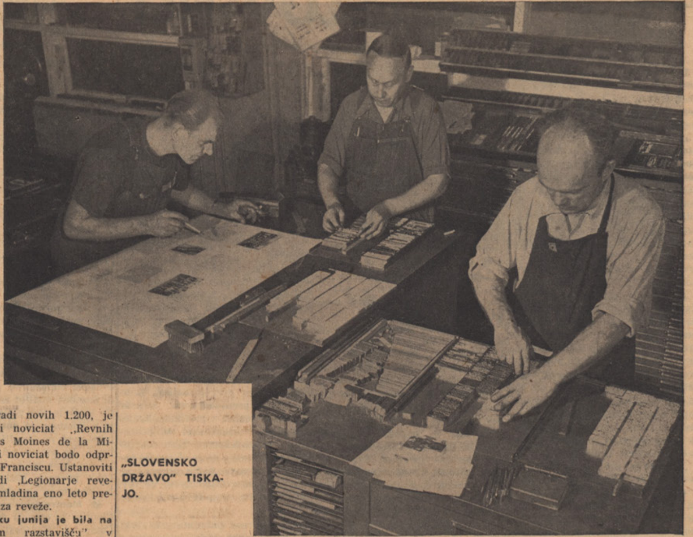
„SLOVENSKO DRŽAVO“ TISKALNO.

● Najdaljša televizijska zveza na svetu bo dograjena 1. 1958 v Kanadi. Za 3.800 milj dolgo zvezo kratkovalovnih zveznih postaj bodo potrebovali 140 enot, ki ne bodo prenašale samo televizijskih programov, marveč tudi radijske pro-