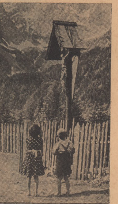
KRIŽ POD ŠPIKOM - 2472 m

(Dr. Karl Renner, socialistični politik, po koncu 2. svetovne vojne predsednik Avstrije. Op. ur.)