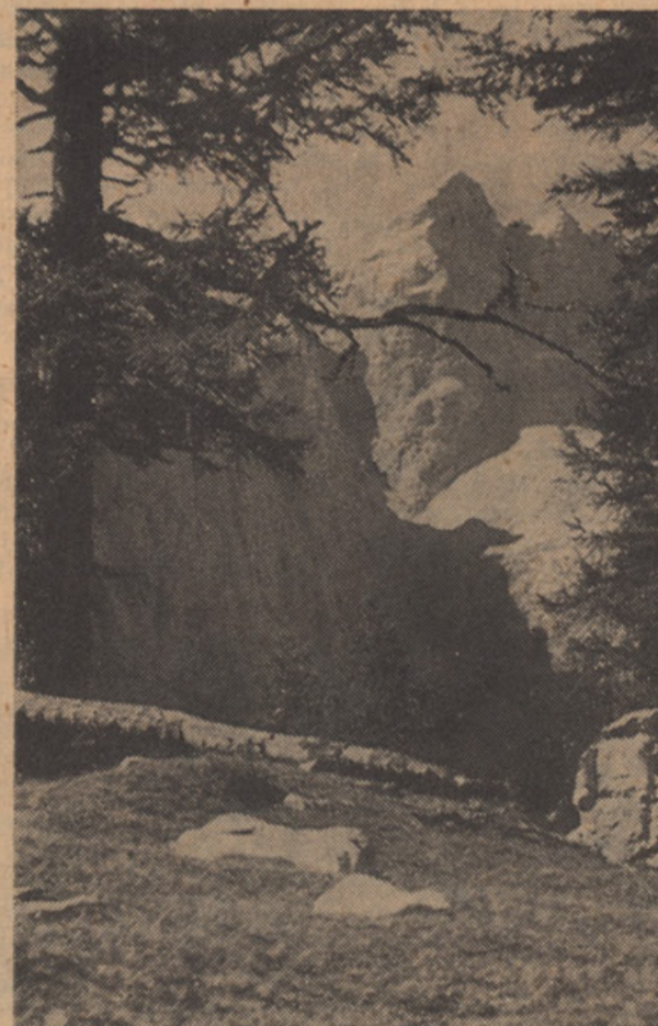
JALOVEC - 2643 m

Peti kongres Federalne zveze evropskih narodov in pokrajin je sklenil v svoji resoluciji, naj Evropsko gibanje in Evropska zveza Federalistov upoštevata, da mora biti bodoča Zedinjena Evropa zgrajena na narodnostih, ne pa na obstoječih državah, če hoče uspevati.