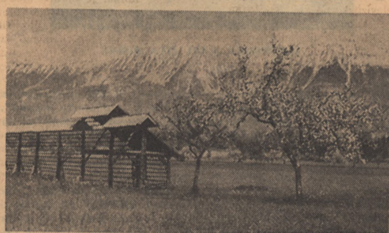
STOL - 2236 m.

V gospodarstvu se je zadnje čase dogodila velika sprememba v razmerju med kapitalom in človeškim delom. V prvi dobi kapitalizma je predstavljalo moč podjetja kljub uvedbi strojev predvsem število zaposlenih delavcev. Danes je število delavcev v mnogih podjetjih drugotnega pomena. Kljub temu smo ohranili še stari sistem, da prispevajo podjetja za razne vrste socialnega zavarovanja in skrbstva po višini plač, ki jih plačujejo svojim delavcem oz. drugim uslužbencem, ne pa svoji dejanski gospodarski moči. Tako plačuje n.p. gospodarsko šibkejša podjetja z velikim številom delavstva mnogo večje prispevke za recimo brezposelno zavarovanje (v Evropi na splošno tudi za bolniško), pokojnine in pdb. kot pa močno avtomatizirano podjetje, ki zaposluje sorazmerno le malo delavcev, čeprav bi drugo podjetje te prispevke mnogo lažje zmoglo kot prvo. Tako sili za star sistem določanja prispevkov za socialne datjave, ki je odgovarjal stvarnosti morda v zgodnji dobi kapitalizma, ki ja danes več ne odgovarja zajetu resnične gospodarske moči podjetij, podjetniki sam po sebi k temu, da uvajajo nove avtomatične stroje ne samo zaradi drugih nevednosti, ki so zve-